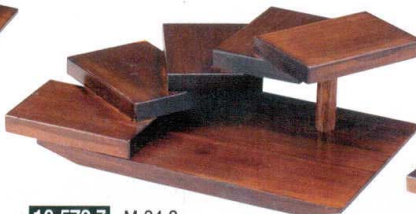
10-572-7 M-34-8 木 五段盛(小) 茶 ¥9,000 (27.5×19.5×8.3) (目皿サイズ10.5×7) 梱10