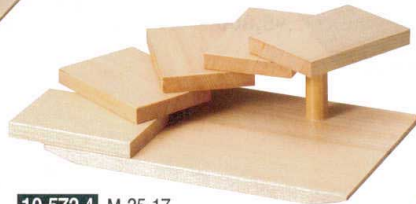
10-572-4 M-25-17 木 五段盛(小) ¥9,000 (27.5×19.5×8.3) (目皿サイズ10.5×7) 梱10