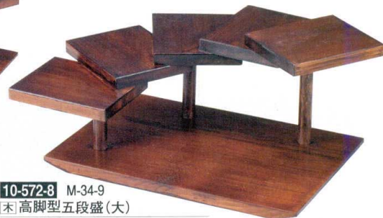
10-572-8 M-34-9 木 高脚型五段盛(大) ¥17,600 (37.5×26×14.5) (目皿サイズ12×10) 梱5