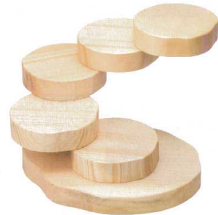
10-572-2 M-35-17 木 変形五段盛 ¥17,000 (31×30×18.5) (目皿サイズ12φ×3) 梱5