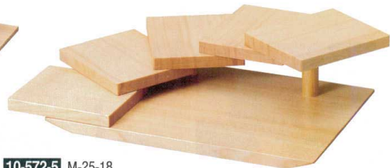
10-572-5 M-25-18 木 五段盛(大) ¥12,000 (37.5×25×8.7) (目皿サイズ12×10) 梱5