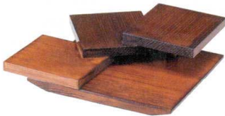
10-572-6 M-34-7 木 三段盛 茶 ¥7,800 (25×23×5.5) (目皿サイズ11×10) 梱15