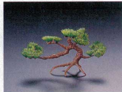
10-584-24 ミニ飾り松(岩なし) 1-752-1 ¥1,100 限定品 (17×6×9) 櫃100