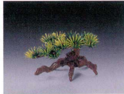
10-584-22 プチ飾り松 M-13-62 ¥650 (5.7×5) 櫃200 限定品