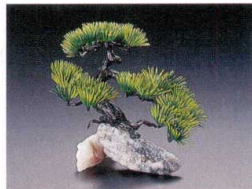
10-584-21 飾り松(小)岩付 1-752-7 ¥5,050 限定品 (17×9×14.5) 櫃72