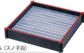
10-584-3 (大) アイスペール (スノ子白) 1-756-2 木枠 ¥5,500 (34×34×6.5) 1-756-2A スノ子 ¥2,800 (29.8×30.2×1.6)