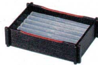
10-584-2 (小) アイスペール (スノ子白) 1-756-1 木枠 ¥4,200 (24.3×17.2×6.5) 1-756-1A スノ子 ¥1,300 (20×13.2×1.6)