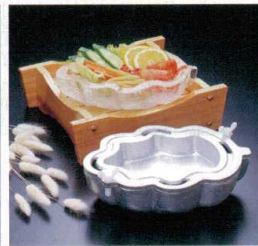
10-584-19 1-756-18 氷鉢 木の葉型製氷器(盛器別売) ¥13,250 (23.5×17×6.5) 1-756-24 (小) 白木舟型盛込器 ¥7,000 (30×21.5×7)