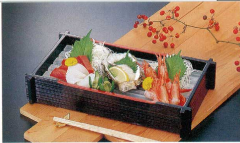
10-584-1 (中) アイスペール (スノ子白) 1-756-3 木枠 ¥4,600 (34×18.8×6.5) 1-756-3A スノ子 ¥1,400 (29.8×15.1×1.6)