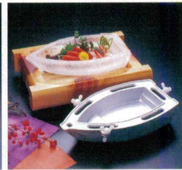
10-584-20 1-756-19 氷鉢 舟型製氷器(盛器別売) ¥13,250 (28×15.2×5.5) 1-756-25 ひの木井桁盛器 ¥14,000 (29×21.2×7)