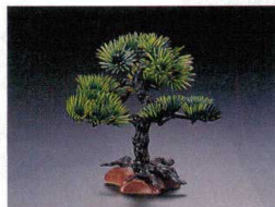
10-584-23 新(小)飾り松 1-752-4 ¥3,600 限定品 (16×10×12) 櫃80