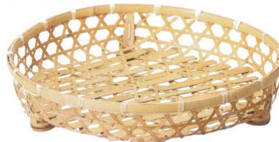
10-597-9 M-24-42 竹 晒竹オードブル 尺4寸 ¥5,700 (42φ×7) 棚10