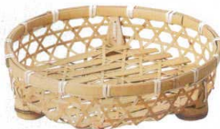
10-597-3 M-24-36 竹 晒竹オードブル 8寸 ¥2,800 (24φ×6) 棚50