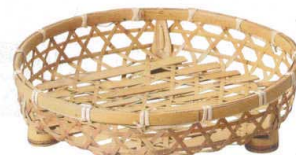
10-597-5 M-24-38 竹 晒竹オードブル 尺0寸 ¥3,950 (30φ×7) 棚20