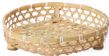
10-597-8 M-24-41 竹 晒竹オードブル 尺3寸 ¥4,800 (39φ×7) 棚20