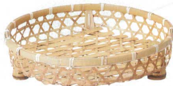
10-597-7 M-24-40 竹 晒竹オードブル 尺2寸 ¥4,350 (36φ×7) 棚20