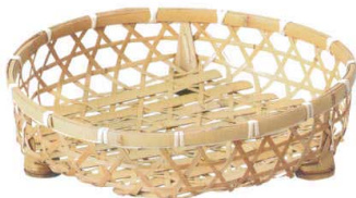
10-597-6 M-24-39 竹 晒竹オードブル 尺1寸 ¥4,100 (33φ×7) 棚20