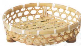
10-597-4 M-24-37 竹 晒竹オードブル 9寸 ¥3,100 (27φ×7) 棚40