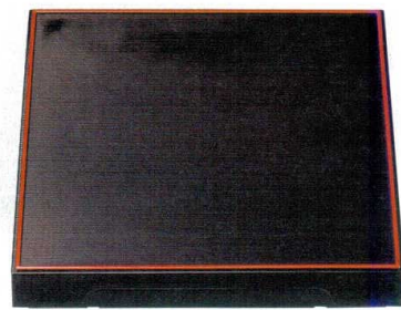
10-606-1 [A] 尺3寸角木目松花堂 黒朱(仕切別) 1-252-1 ¥4,850 (38×38×6.7) 櫃10