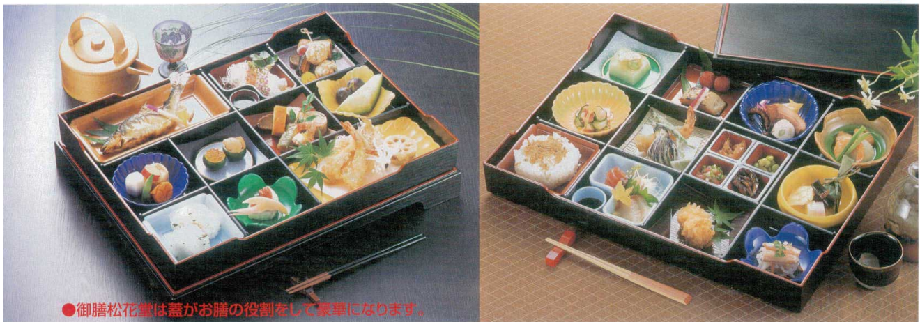
●御膳松花堂は蓋がお膳の役割をして豪華になります。