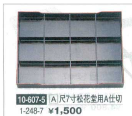
10-607-5 [A]尺7寸松花堂用A仕切 1-248-7 ¥1,500