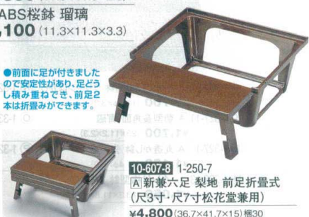
10-607-8 1-250-7 [A]新兼六足 梨地 前足折畳式 (尺3寸・尺7寸松花堂兼用) ¥4,800(36.7×41.7×15) 梱30

●前面に足が付きましたので安定性があり、足どうし積み重ねでき、前足2本は折畳みができます。