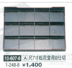
10-607-6 [A]尺7寸松花堂用B仕切 1-248-8 ¥1,400