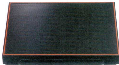
10-607-1 [A]尺7寸長手御膳千筋松花堂 1-248-6 黒天朱内黒塗(仕切別)(強化ABS) ¥8,350(50.5×38.5×7) 梱10