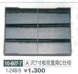
10-607-7 [A]尺7寸松花堂用C仕切 1-248-9 ¥1,300

●前面に足が付きましたので安定性があり、足どうし積み重ねでき、前足2本は折畳みができます。