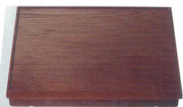
10-607-3 [A]尺7寸長手千筋会席松花堂 1-250-3 溜内黒塗(仕切別)(強化ABS) ¥8,400(50×37.8×7) 梱10