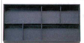
10-608-9 [A] 新尺7寸松花堂用 木目C仕切 1-258-5 ¥800