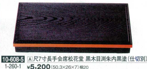
10-608-5 [A] 尺7寸長手会席松花堂 黒木目測朱内黒塗 (仕切別) 1-260-1 ¥5,200 (50.3×26×7) 梱20