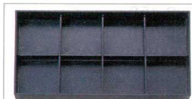
10-608-7 [A] 新尺7寸松花堂用木目A仕切 1-258-3 ¥780