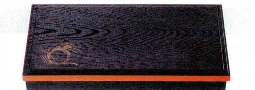
10-608-6 [A] 尺7寸長手会席松花堂 黒木目測朱柳結び内黒塗 (仕切別) 1-260-2 ¥5,600 (50.3×26×7) 梱20