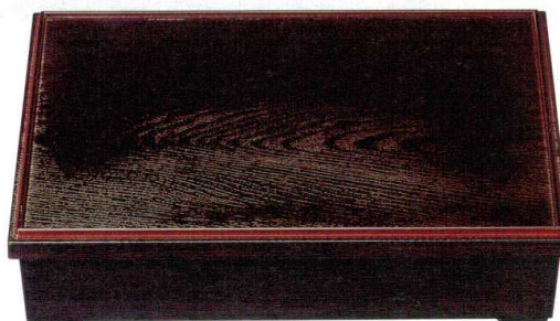
10-612-3 A ニュー尺3寸深型長手木目松花堂 溜 C-5-13 ¥4,450 (38.5×26.5×9.2) (内寸36.2×24.4×7.5) 櫃20