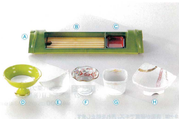
10-612-4 A ニュー尺3寸深型長手木目松花堂 溜内ノンスリップ加工 C-5-38 ¥5,000 (38.5×26.5×9.2) (内寸36.2×24.4×7.5) 櫃20