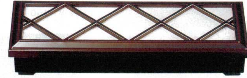
10-618-6 A 1段四季弁当 溜パール内朱(障子蓋+3ツ仕切) ¥3,700 (37.3×13.5×6.5) 櫃40