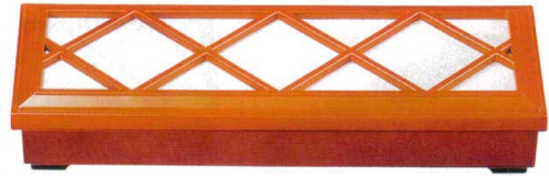
10-618-1 A 1段四季弁当 春慶(障子蓋+3ツ仕切) ¥4,300 (37.3×13.5×6.5) 櫃40