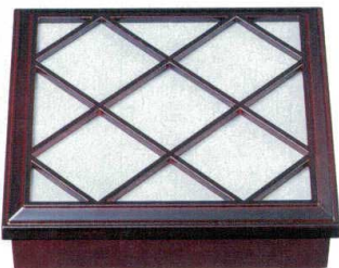
10-626-3 A 8.5寸松花堂用障子蓋 溜 C-1-10 ¥2,800 (26×26×2・内寸25×25)