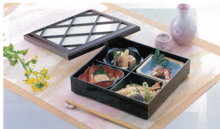
10-626-4 A 8.5寸木目松花堂 身 溜内黒塗 C-1-90 ¥1,150 (24.5×24.5×5.9)