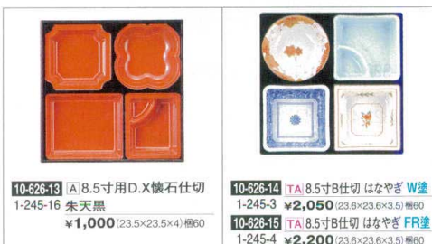
10-626-13 A 8.5寸用D.X懐石仕切 1-245-16 朱天黒 ¥1,000 (23.5×23.5×4) 櫃60