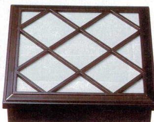
10-626-11 A 8.5寸松花堂用障子蓋 溜 C-1-10 ¥2,800 (26×26×2・内寸25×25)