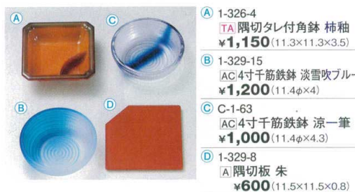
A 1-326-4 TA 隅切タレ付角鉢 柿釉 ¥1,150 (11.3×11.3×3.5)