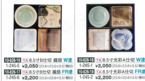
10-626-16 TA 8.5寸B仕切 織部 W塗 1-245-5 ¥2,050 (23.6×23.6×3.5) 櫃60 10-626-17 TA 8.5寸B仕切 織部 FR塗 1-245-6 ¥2,200 (23.6×23.6×3.5) 櫃60