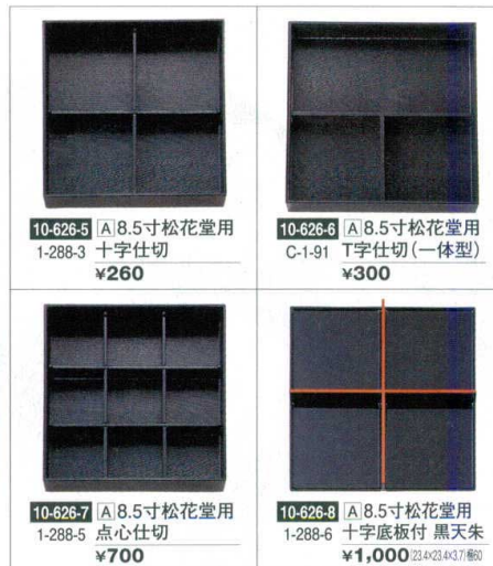
10-626-5 A 8.5寸松花堂用 1-288-3 十字仕切 ¥260