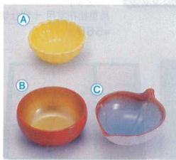
A 1-337-12 陶2.6寸菊型千代久 黄 ¥1,000 (7.3φ×3.3) 櫃100 B 1-339-9 A 2.6寸丸鉢 朱内金 ¥800 (8φ×3.6) 櫃200 C 1-338-7 M この葉鉢 青磁 ¥1,050 (10×8.1×3.5) 櫃200