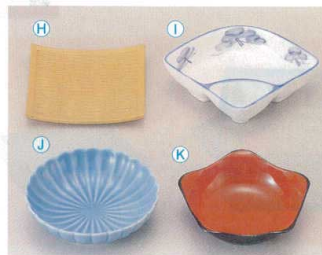
H 1-329-1 A 角竹皿 クリーム ¥730 (11×11×1) 櫃200 I C-3-16 陶扇型タレ付鉢 松 限定品 ¥550 (15×13.2×3.6) 櫃80 J 1-332-10 陶3.8寸菊型鉢 トルコ ¥1,350 (11.3φ×3.4) 櫃80 K 1-328-13 A 五角鉢 朱 ¥550 (11×11×3.4) 櫃200

限定品 海外生産のため、在庫を確認の上、ご注文下さい。 ※オプションは、647頁～659頁参照