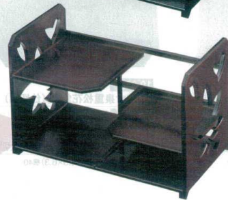
10-631-6 1-299-2 A 花御膳 溜 ¥3,700 (25.2×13.7×16.7) 櫃25