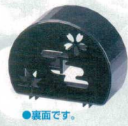
10-631-2 C-1-98 A ABS鎌倉松花堂 新溜塗 (小) ¥3,300 (19.3×8.7×15.5) 櫃20