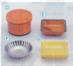
D 1-221-8 TA (中)メンバ飯器 春慶内黒塗 ¥1,700 (11.8φ×8.1) 櫃100 E 1-326-4 TA 隅切タレ付角鉢 柿釉 ¥1,150 (11.3×11.3×3.5) 櫃200 F C-1-34 TA 3.8寸菊鉢 銀塗 ¥1,450 (11.3φ×3.3) 櫃200 G 1-324-9 A 竹割皿 黄 ¥1,300 (11.2×11.2×3.5) 櫃200