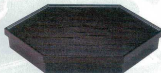
10-633-2 C-6-35 A 六角へぎ目松花堂 溜内黒塗 ¥3,900 (36×18.8×5.8) 櫃20