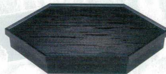
10-633-1 C-6-34 A 六角へぎ目松花堂 黒内黒塗 ¥3,000 (36×18.8×5.8) 櫃20