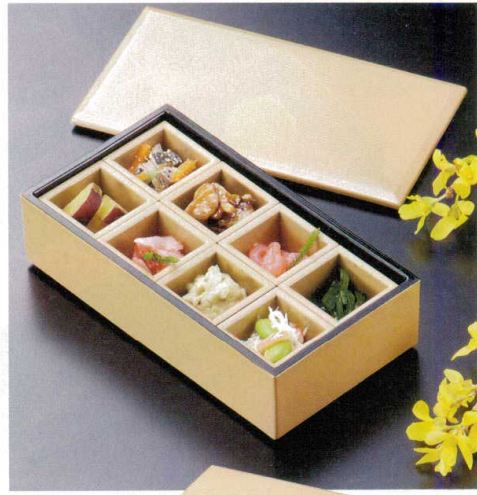
10-634-4 [A]小町弁当 C-3-27 蓋 白漆内黒塗 ¥1,300 (17.5×9.5×0.5) 櫃200 C-3-28 親 白漆内黒塗裏黒塗 ¥1,550 (17.5×9.5×4.5) 櫃100