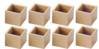
10-634-5 [A]プチマス M-14-38 総白漆裏黒塗1ヶ ¥600 (4×4×3.5)