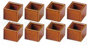
10-634-2 [A]プチマス M-14-39 漆調総春慶裏黒塗1ヶ ¥850 (4×4×3.5)