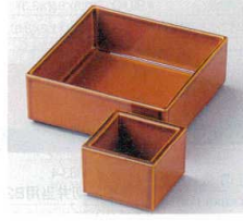
10-634-11 C-3-65 [A]華角鉢 漆調総春慶裏黒塗 ¥1,500 (11.8×11.8×4.4) 10-634-12 M-14-41 [A]5勺マス 漆調総春慶裏黒塗 1ヶ ¥1,000 (5.9×5.9×4.2) 櫃200 10-634-13 M-17-16 [A]ニュー5勺マス 漆調総春慶裏黒塗 1ヶ ¥1,000 (5.8×5.8×4.3) ニュー5勺マスは、内側底が丸くなっています。