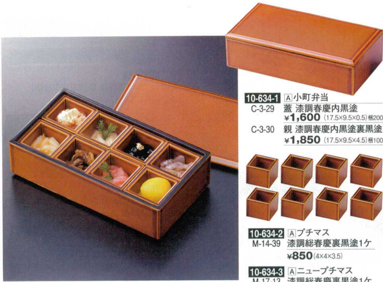
10-634-1 [A]小町弁当 C-3-29 蓋 漆調春慶内黒塗 ¥1,600 (17.5×9.5×0.5) 櫃200 C-3-30 親 漆調春慶内黒塗裏黒塗 ¥1,850 (17.5×9.5×4.5) 櫃100