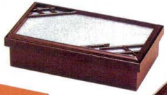
10-640-3 C-1-16 (A) 小町弁当用障子蓋 溜(本体別) ¥1,850 (18.5×10.5×1.6) 櫃100