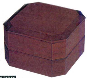
10-640-11 (A) 6寸ヘギ目松花堂 溜内朱 1-309-1 蓋のみ ¥950 (18.9×18.9×1) 櫃100 1-309-1A 親のみ ¥1,400 (18.9×18.5×5.8) 櫃80 1段 ¥2,350 (18.9×18.9×7) 櫃60 2段 ¥3,750 (18.9×18.9×12.3) 櫃30