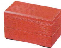
10-640-5 (A) 秀吉弁当 朱内黒塗 蓋のみ C-2-2 ¥950 (18×10×2.5) 櫃100