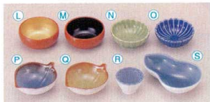
(L) 1-339-9 (A) 2.6寸丸鉢 朱内金 ¥800 (8φ×3.6) (M) 1-339-8 (A) 2.6寸丸鉢 朱内黒 ¥450 (8φ×3.6) (N) 1-337-13 陶 2.6寸菊型千代久 グリーン 限定品 ¥850 (7.8φ×3.3) (O) 1-337-15 陶 2.6寸菊型千代久 瑠璃 ¥1,000 (7.8φ×3.3) (P) 1-338-7 (M) この葉鉢 青磁 ¥1,050 (10×8.1×3.5) (Q) 1-338-8 (M) この葉鉢 織部 ¥1,050 (10×8.1×3.5) (R) 1-339-29 (M) 菊千代久 青磁 ¥730 (5.2φ×3.6) (S) 1-326-10 (M) ひさご鉢 青磁 ¥900 (12.8×8.7×3.3) (T) 1-309-11 (A) 6寸松花堂用十字仕切 ¥700 (U) 1-309-1J (A) 6寸松花堂用T字仕切(一体型) ¥800