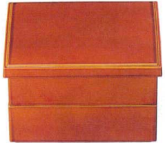
10-640-10 (A) 5寸ミニ松花堂 漆調春慶内黒塗 F-4-23 蓋 漆調春慶内黒塗 ¥1,850 (15.9×15.9×1.4) 櫃100 F-4-24 親 漆調春慶内黒塗 ¥2,000 (15×15×4.5) 櫃80 F-4-9 十字仕切 黒 ¥350 (14×3)