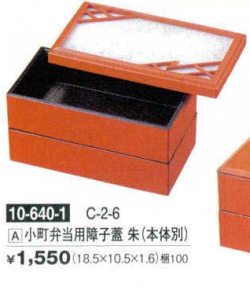
10-640-1 C-2-6 (A) 小町弁当用障子蓋 朱(本体別) ¥1,550 (18.5×10.5×1.6) 櫃100