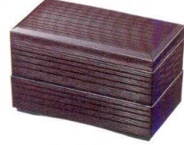
10-640-7 (A) 秀吉弁当 溜内朱 蓋のみ C-2-4 ¥1,100 (18×10×2.5) 櫃100