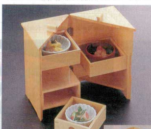
10-643-15 木開き弁当3段 1-317-2 ¥22,800 (14×14×23) 櫃20 A 陶 3寸菊型千代久 青磁 ¥1,000 B A 2.6寸丸鉢 朱内金 ¥800 C 陶 2.6寸菊型千代久 青磁 ¥1,000