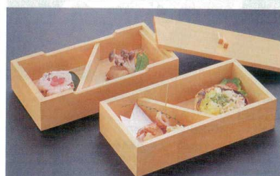
10-643-7 1-317-8 木石切弁当 2段 ¥13,900 (26.3×13×13.5) 櫃20