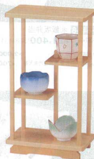
10-643-11 木白木とまり木 1-317-6 ¥6,600 (17×10×30) 櫃20 A 陶 (大) ぼんぼり ¥1,400 B 陶 桜型陶器 ブルー ¥1,250 C 陶 チューリップ珍珠 グリーン ¥1,250