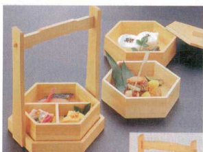
10-643-9 1-316-3 木六角手提げ弁当 ¥16,500 (20.1×20×26) 櫃10