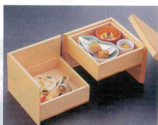
10-643-16 木開き弁当 1-317-1 ¥20,500 (20×20×13.5) 櫃20 A M ひさご鉢 グリーン ¥900 B A 2.3寸丸鉢 朱内金 ¥950 C 陶 青磁太ア3松型千代久の ¥750