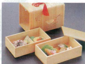
10-643-10 1-316-6 木弥生弁当 ウグイス ¥15,000 (18×11.2×12.8) 櫃20