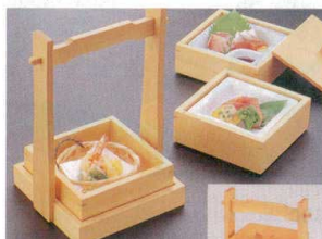
10-643-4 木手正角弁当 1-316-4 ¥15,400 (20×16×26) 櫃10 A 陶 コスー珍仕切付鉢 ¥1,600 C 竹丸かご ¥480