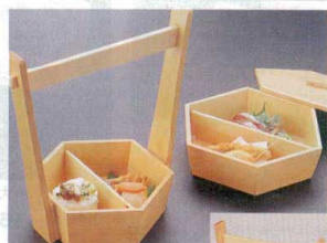
10-643-5 1-316-5 木手桶2段弁当 ¥17,100 (25.2×20.7×26) 櫃10