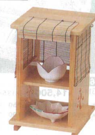
10-643-6 木近江路すだれ付 1-317-7 ¥14,000 (15×15×23) 櫃20 A 陶 チューリップ珍珠 ピンク ¥1,250 B 陶 小鉢 紅葉 ¥1,700