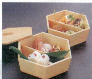
10-643-14 1-316-8 木六角弁当 ¥12,300 (20.7×17.8×13) 櫃20