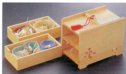
10-643-1 木2段引き出し弁当 1-316-1 ¥18,150 (21×12.5×18) 櫃20 A M この葉鉢 織部 ¥1,050 B M 花鉢 オレンジグリーン ¥950 C M ひさご鉢 グリーン ¥900 D 陶 桜型陶器 ブルー ¥1,100