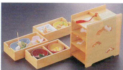
10-643-2 木3段引き出し弁当 1-316-2 ¥19,800 (21×12.5×20.5) 櫃20 A 陶 3寸角鉢 青磁 ¥1,100 B 陶 2.6寸菊型千代久 黄 ¥1,000 C M ひさご鉢 青磁 ¥900 D 陶 チューリップ珍珠 ピンク ¥1,100 E A 2.6寸丸鉢 黒内朱 ¥450 F A 2.6寸丸鉢 朱内金 ¥800