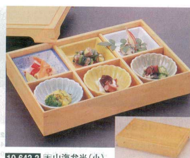
10-643-3 木山海弁当(小) 1-317-9 ¥15,000 (32.2×22×6) 櫃20 A 陶 3寸角鉢 吹墨 ¥1,400 D 陶 3寸菊型千代久 青磁 ¥1,000 B 陶 3寸角鉢 黄 ¥1,300 E 陶 3寸菊型千代久 黄 ¥1,000 C 陶 3寸角鉢 青磁 ¥1,100 F 陶 3寸菊型千代久 ヒワ ¥1,000