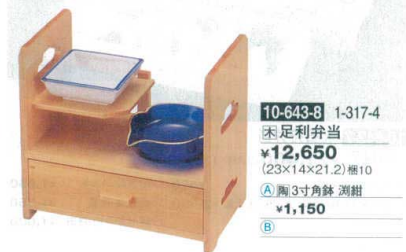
10-643-8 1-317-4 木足利弁当 ¥12,650 (23×14×21.2) 櫃10 A 陶 3寸角鉢 海紺 ¥1,150 B