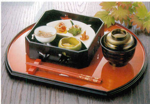
A面 B面 裏面刷毛目 10-66-7 A 半月両面盆 朱瀾黒/黒刷毛目 1-83-17 尺1寸 ¥2,350 (33.5×29.2×2) 棚50 1-83-18 尺2寸 ¥2,550 (36.5×31.7×2) 棚40 1-83-19 尺3寸 ¥2,850 (39.8×34.5×2.1) 棚40 1-83-20 尺4寸 ¥3,500 (42×36×2.2) 棚30 1-83-21 尺5寸 ¥4,150 (45×38.3×2.4) 棚30