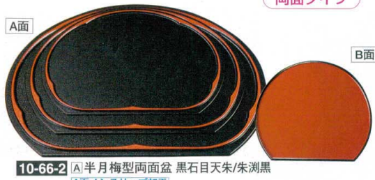
10-66-2 A 半月梅型両面盆 黒石目天朱/朱瀾黒 A面ノンスリップ加工 B-7-78 尺1寸 ¥2,150 (33.5×29.2×1.5) 棚50 B-7-79 尺3寸 ¥3,000 (40×34.5×1.5) 棚40 B-7-80 尺5寸 ¥3,950 (44.8×38.5×1.5) 棚30