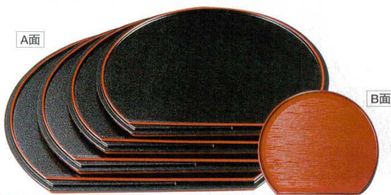
10-66-3 A 半月小町会席盆 黒石目天朱/溜春慶焼杉黒 A面ノンスリップ加工 B-7-74 尺2寸 ¥2,800 (36.5×31.5×1.5) 棚40 B-7-75 尺3寸 ¥3,200 (39.5×34.3×1.5) 棚40 B-7-76 尺4寸 ¥4,100 (42.4×36.7×1.5) 棚30 B-7-77 尺5寸 ¥4,450 (45.6×39.4×1.5) 棚30