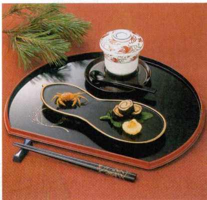
裏面布目 B面 A面 10-66-5 A 半月両面盆 柳結び/グリーン布目 1-82-31 尺2寸 ¥2,400 (36×30.4×1.8) 棚40 1-82-32 尺3寸 ¥3,000 (39.7×34.3×2) 棚40