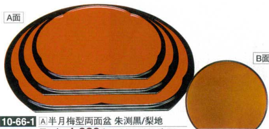
10-66-1 A 半月梅型両面盆 朱瀾黒/梨地 1-81-20 尺1寸 ¥1,930 (33.5×29.2×1.5) 棚50 1-81-21 尺3寸 ¥2,900 (40×34.5×1.5) 棚40 1-81-22 尺5寸 ¥3,400 (44.8×38.5×1.5) 棚30