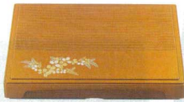
10-663-1 1-345-1 A 尺7寸百万石千筋箱膳 梨地萩 (D.X仕切付) ¥14,500 (50×36.5×7.3) 櫃10