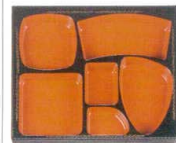
10-663-22 1-347-7 A 尺2寸千筋箱膳用 B仕切 朱天黒唐草 ¥2,000 (34×28×4) 櫃30