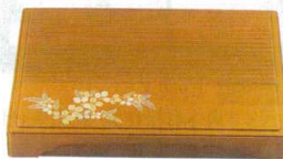
10-663-4 1-345-4 A 尺5寸千筋箱膳 梨地萩 (D.X仕切付) ¥10,350 (46×33.8×7.3) 櫃10