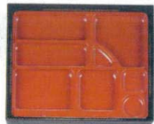
10-663-9 1-346-6 A 尺3寸千筋箱膳用 A仕切 朱天黒唐草 ¥2,100 (37.8×30.9×4.1) 櫃40