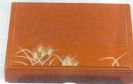
10-663-8 1-346-3 A 尺3寸千筋箱膳 梨地麦 (仕切別) ¥5,300 (40×33×6.7) 櫃10