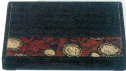
10-663-3 1-345-3 A 尺5寸千筋箱膳 合作牡丹 (D.X仕切付) ¥9,800 (46×33.8×7.3) 櫃10