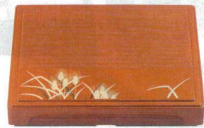
10-663-16 1-347-3 A 尺2寸千筋箱膳 梨地麦 (仕切別) ¥4,050 (36×30×6.3) 櫃20