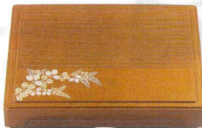
10-663-15 1-347-2 A 尺2寸千筋箱膳 梨地萩 (仕切別) ¥4,050 (36×30×6.3) 櫃20