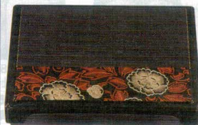
10-663-17 1-348-1 A 尺1寸千筋箱膳 合作牡丹 (仕切付) ¥4,900 (34×28×6) 櫃20