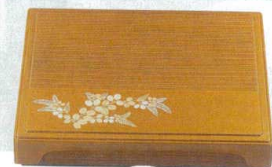
10-663-7 1-346-2 A 尺3寸千筋箱膳 梨地萩 (仕切別) ¥5,250 (40×33×6.7) 櫃10