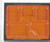
10-663-20 1-347-5 A 尺2寸千筋箱膳用 A仕切 朱天黒唐草 ¥1,650 (34×28×4) 櫃30