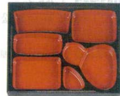
10-663-11 1-346-8 A 尺3寸千筋箱膳用 B仕切 朱天黒唐草 ¥2,100 (37.8×30.9×4.1) 櫃40