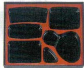
10-663-10 1-346-7 A 尺3寸千筋箱膳用 B仕切 黒天朱唐草 ¥2,100 (37.8×30.9×4.1) 櫃40