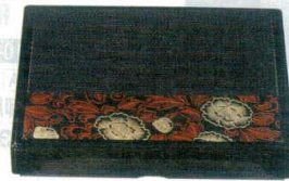
10-663-6 1-346-1 A 尺3寸千筋箱膳 合作牡丹 (仕切別) ¥5,150 (40×35×6.7) 櫃10