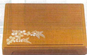
10-663-18 A 尺1寸千筋箱膳 梨地萩 (仕切付) 1-348-2 ¥5,200 (34×28×6) 櫃20