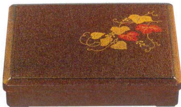
10-672-1 尺1寸長手三里弁当 1-364-1 パールツタ (仕切付) ¥2,900 (30.8×24.7×6) 櫃20