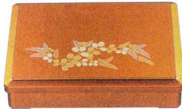
10-672-2 尺1寸長手三里弁当 1-364-3 金梨地萩 (仕切付) ¥3,100 (30.8×24.7×6) 櫃20