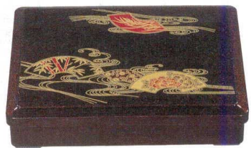
10-672-6 尺1寸長手三里弁当 1-364-4 茶パール扇面 (仕切付) ¥3,100 (30.8×24.7×6) 櫃20