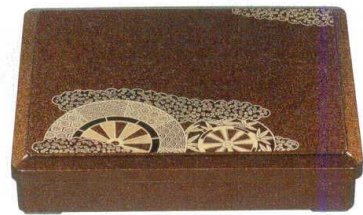
10-672-3 尺1寸長手三里弁当 1-364-2 梨地御所車 (仕切付) ¥3,100 (30.8×24.7×6) 櫃20