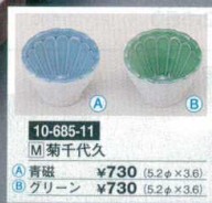
10-685-11 M 菊千代久 A 青磁 ¥730 (5.2φ×3.6) B グリーン ¥730 (5.2φ×3.6)