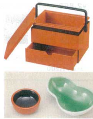
10-685-18 1-339-26 A | ミニ丸鉢 朱内黒 ¥500 (8.3φ×3.1) 1-326-9 M | ひさご鉢 グリーン ¥900 (12.8×7×3.3)