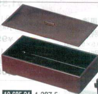
10-685-24 1-387-5 A | 上段 溜内黒塗 ¥1,450 (21.3×10.6×5.6) 幅50