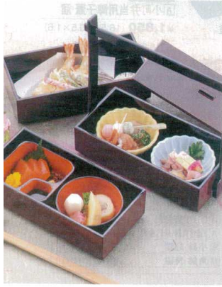
10-685-21 1-385-8 A | 金華弁当用大仕切 朱 ¥1,000 (22×10.9×2.7)