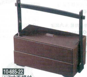
10-685-22 A | 7寸手提付 お好み千筋弁当 溜内黒塗 1段 (オプション別) ¥3,700 (25.3×10.6×22) 幅60 2段 (オプション別) ¥5,150 (25.3×10.6×22) 幅30