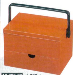
10-685-17 1-387-1 A | 源氏手提弁当 朱 (オプション別) ¥4,500 (19.2×12.7×17.6) 幅20 (手扱いは折畳できます)