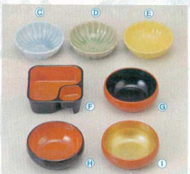
10-685-26 C 圓3寸菊型千代久 青磁 ¥1,000 (9φ×3.2) D 圓3寸菊型千代久 ヒワ ¥1,000 (9φ×3.2) E 圓3寸菊型千代久 黄 ¥1,000 (9φ×3.2) F A | 3.2寸タレ付角鉢 朱天黒 ¥650 (9.7×9.7×3.8) G A | 3.3寸丸鉢 朱内黒 ¥470 (9.7φ×3.8) H A | 3.3寸丸鉢 黒内朱 ¥470 (9.7φ×3.8) I A | 3.3寸丸鉢 朱内金 ¥850 (9.7φ×3.8)