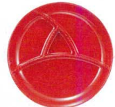
10-706-14 F-2-40 M 8寸盛込椀用 弁当仕切朱 ¥1,950 (22.2φ×2.5) 椀50