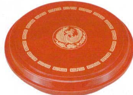
10-706-16 1-425-3 A 丸オーダブル弁当 中華内朱 (仕切固定) ¥5,550 (36.5φ×7.5) 椀20