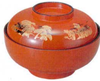
10-706-2 1-703-5 A 6.5寸盛込椀 老松内黒塗 (仕切別) ¥3,500 (19.8φ×13) 椀40