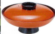
10-706-11 W-2-58 M 8寸盛込椀 朱 (仕切別) ¥5,300 (23.9φ×12.3) 椀40