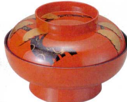
10-706-9 1-703-9 A 尺2寸盛込椀 老松内黒塗 手描蒔絵 (仕切別) ¥14,000 (37φ×24.5) 椀10