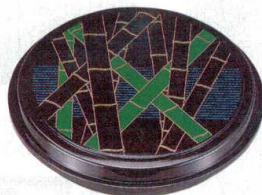
10-706-15 1-425-2 A 丸オーダブル弁当 茶パール竹内朱 (仕切固定) ¥5,550 (36.5φ×7.5) 椀20