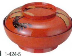
10-706-6 1-424-5 A 尺0寸御殿盛込椀 老松内黒塗手描蒔絵 (仕切別) ¥9,900 (30φ×16) 椀20