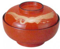
10-706-3 1-703-4 A 6.5寸盛込椀 鶴内黒塗 (仕切別) ¥3,300 (19.8φ×13) 椀40