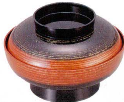
10-706-8 1-702-5 A 尺2寸盛込椀 レインボー内黒塗 (仕切別) ¥12,500 (37φ×24.5) 椀10