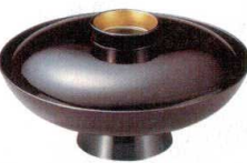
10-706-13 W-7-17 M 8寸盛込椀 溜つば金 (仕切別) ¥5,600 (23.9φ×12.3) 椀40