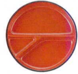
10-706-4 1-424-4 A 6.5寸盛込椀 弁当仕切朱 ¥900 (18.8φ×3.7) 椀80楕