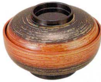
10-706-1 1-702-1 A 6.5寸盛込椀 レインボー内黒塗 (仕切別) ¥4,000 (19.8φ×13) 椀40