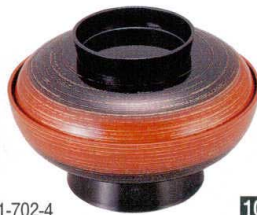
10-706-5 1-702-4 A 尺0寸盛込椀 レインボー内黒塗 (仕切別) ¥8,500 (30φ×20) 椀20