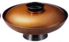
10-706-12 W-7-16 M 8寸盛込椀 金梨地つば黒 (仕切別) ¥5,400 (23.9φ×12.3) 椀40