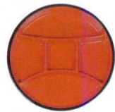
10-706-10 1-424-10 A 尺2寸盛込椀用 弁当仕切朱 ¥2,400 (35.7φ×4.7) 椀30