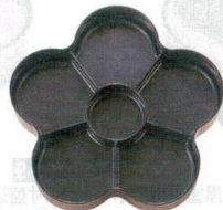
10-707-6 1-423-4 A 光梅弁当用仕切 黒 ¥1,100 (30.8×27.6×3.4) 棚40