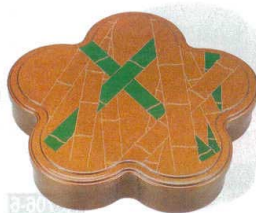
10-707-3 1-423-1 A 光梅弁当 金梨地竹林 (仕切別) ¥4,700 (33×30×5.9) 棚20