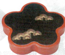
10-707-4 1-423-2 A 光梅弁当 朱パール若松 (仕切別) ¥4,900 (33×30×5.9) 棚20