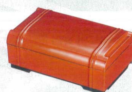
10-707-28 A 竹型弁当 春慶 (仕切別) F-3-45 ¥2,350 (25×15.8×10) 棚40