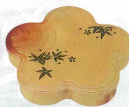
10-707-5 1-423-3 A 光梅弁当 花梨春秋内黒塗 (仕切別) ¥8,000 (33×30×5.9) 棚20