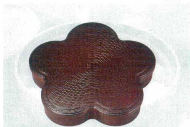
10-707-2 A 竹目光梅弁当 溜 F-3-11A 蓋 ¥2,100 (33×30×2) 棚60 F-3-11 身 ¥2,700 (32×28.8×5.5) 棚30