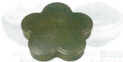
10-707-1 A 竹目光梅弁当 グリーン F-3-10A 蓋 ¥2,100 (33×30×2) 棚60 F-3-10 身 ¥2,700 (32×28.8×5.5) 棚30