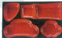
10-707-29 A 竹型弁当用 D.X 仕切 朱天黒 F-3-46 ¥1,100 (24×14.7×3.6) 棚80