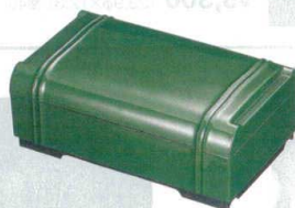
10-707-27 A 竹型弁当 グリーン (仕切別) F-3-44 ¥2,000 (25×15.8×10) 棚40