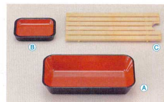
10-708-7 A 1-519-3 A 中子(1ヶ) ¥650 (16.3×8.8×3.4) B 1-519-4 A のぞき ¥500 (7.9×5.9×1.5) C 1-519-5 AP スノ子 ¥550 (18.1×8×1)