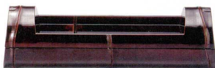
10-708-5 A 竹姫弁当 溜内溜塗 上段 S-7-94 ¥2,700 (36.1×10.3×5.9)