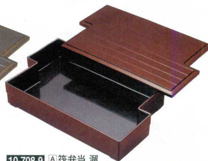
10-708-9 A 筏弁当 溜 F-2-79 蓋 ¥2,050 (37.2×22.8×1.6) 棚80 F-2-80 親 ¥2,150 (37.2×22.5×6.5) 棚40