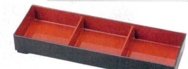
10-708-12 F-2-84 A 筏弁当用大仕切三ツ仕切 内朱天黒 1ヶ ¥1,200 (32.8×10.8×4.6)