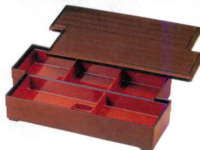
10-708-10 F-2-81 A 筏弁当用小仕切 内朱天黒 1ヶ ¥700 (10.8×10.8×4)