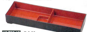
10-708-13 F-2-83 A 筏弁当用大仕切タレ付 内朱天黒 1ヶ ¥1,200 (32.8×10.8×4.6)