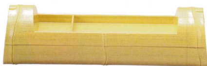
10-708-3 A 竹姫弁当 ゴマ竹 上段 S-9-31 ¥3,200 (36.1×10.3×5.9)