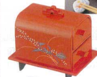
10-709-9 1-427-4 A 桃山弁当 黒露草内朱 ¥6,300 (18.5×12.9×16.3) 梱30