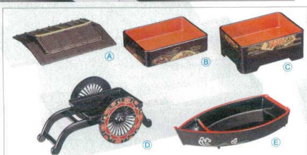
10-709-12 徳川弁当用オプション A 1-427-1A A 屋根 ¥1,750 (19.1×15×4.5) B 1-427-1B A 中段 ¥2,150 (16.5×12.5×4.3) C 1-427-1C A 下段 ¥2,450 (16.5×12.5×7.1) D 1-427-1D A 御所車 ¥3,100 (32.8×17.7×13.6) E 1-708-2 A 屋形舟のみパール波 ¥2,450 (33×17.2×7)