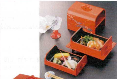
10-709-8 1-427-3 A 桃山弁当 朱露草内黒塗 ¥6,300 (18.5×12.9×16.3) 梱30