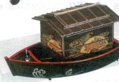
10-709-11 A 徳川弁当 茶パール扇面 屋形舟付2段セット ¥8,800 (33×17.2×16) 梱20