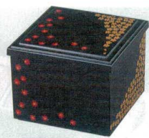
10-709-3 1-313-1 A 開き弁当 黒乾漆春秋(中箱・仕切別) ¥9,100 (17.1×17.1×14) 梱20