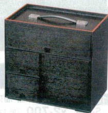
10-709-6 A 野立弁当 黒天朱 仕切付(長皿・武蔵野椀別)本体のみ 1-426-5 ¥8,900 (24.2×14.6×22.4) 梱10