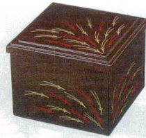
10-709-2 1-313-4 A 開き弁当 梨地松葉(中箱・仕切別) ¥6,350 (17.1×17.1×14) 梱20