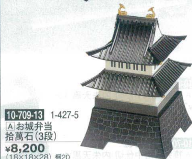
10-709-13 1-427-5 A お城弁当 拾萬石(3段) ¥8,200 (18×18×28) 梱20