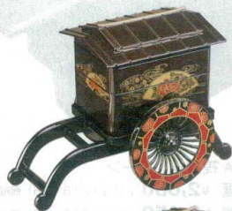
10-709-10 A 徳川弁当 茶パール扇面 御所車付2段セット ¥9,450 (32.8×17.7×26) 梱20