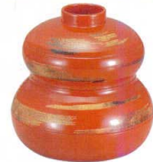
10-716-1 1-437-1 Mびく弁当 黒内朱 ¥3,100 (12φ×11.5) 楕50