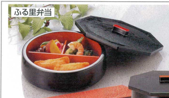
10-716-14 F-1-68 Aふる里弁当用 多用仕切 ¥500 (15.4×7.7×3.2)