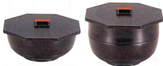
10-716-11 A 5.5寸武蔵野椀 黒刷毛目内朱 1段(蓋付) ¥3,450 (17.7×19×8.5) 楕36 2段(蓋付) ¥5,450 (17.7×19×13) 楕18 1-543-19 5.5寸ボール用蓋 ¥1,150 (17.7×19×2.2) 楕100 1-439-8 5.5寸武蔵野椀用中段 ¥2,000 (16.7φ×4.7) 楕60 1-543-4 5.5寸武蔵野椀用下段 ¥2,300 (16.6φ×7.3) 楕60