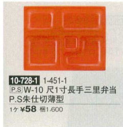
10-728-1 1-451-1 P.S.W-10 尺1寸長手三里弁当 P.S朱仕切薄型 1ヶ ¥58 梱1,600