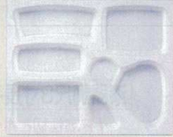
10-728-18 F-2-75 P.S.W-7 尺3寸長手 P.S白仕切 1ヶ ¥99 梱700