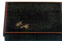
10-728-12 1-367-1 A新尺1寸長手松花堂 黒天朱笹(仕切別) ¥2,900 (31.3×26×6.8) 梱20