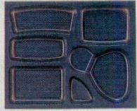
10-728-19 1-451-12 P.S.W-7 尺3寸長手 P.S 黒仕切 1ヶ ¥99 梱700