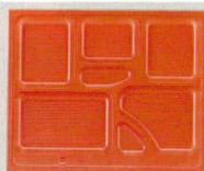
10-728-13 1-451-8 P.S.W-6 尺2寸長手 P.S朱仕切 1ヶ ¥85 梱800