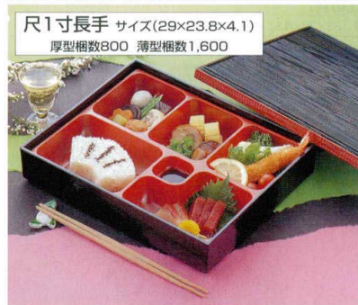
尺1寸長手 サイズ(29×23.8×4.1) 厚型梱数800 薄型梱数1,600