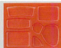
10-728-17 1-451-11 P.S.W-7 尺3寸長手 P.S朱仕切 1ヶ ¥99 梱700