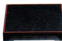
10-728-11 1-241-6 A尺1寸長手御膳千筋松花堂 黒天朱(仕切別) ¥2,850 (31.3×26×7) 梱20