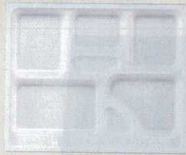
10-728-14 F-2-68 P.S.W-6 尺2寸長手 P.S白仕切 1ヶ ¥85 梱800