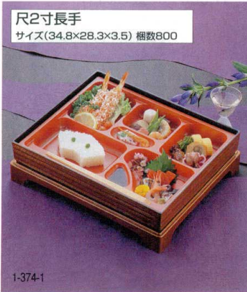
尺2寸長手 サイズ(34.8×28.3×3.5) 梱数800