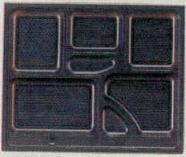
10-728-15 1-451-9 P.S.W-6 尺2寸長手 P.S黒仕切 1ヶ ¥85 梱800