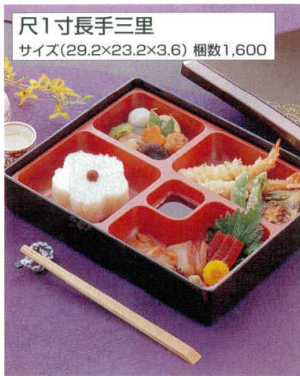
尺1寸長手三里 サイズ(29.2×23.2×3.6) 梱数1,600