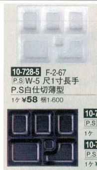
10-728-5 F-2-67 P.S.W-5 尺1寸長手 P.S白仕切薄型 1ヶ ¥58 梱1,600