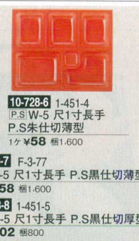
10-728-6 1-451-4 P.S.W-5 尺1寸長手 P.S朱仕切薄型 1ヶ ¥58 梱1,600