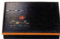
10-728-10 1-240-6 A尺1寸長手木目松花堂 黒淵朱春秋(仕切別) ¥3,150 (31.5×26×7) 梱20