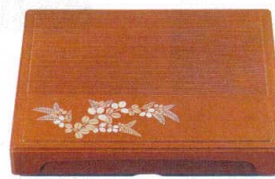
10-728-20 1-346-2 A尺3寸千筋箱膳 梨地萩(仕切別) ¥5,250 (40×33×6.7) 梱10