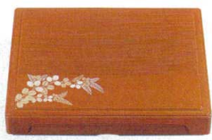
10-728-16 1-347-2 A尺2寸千筋箱膳 梨地萩(仕切別) ¥4,050 (36×30×6.3) 梱20