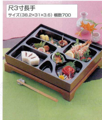
尺3寸長手 サイズ(38.2×31×3.6) 梱数700