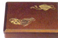
10-728-4 1-451-3 A尺1寸長手三里弁当 梨地見合せ(仕切別) ¥2,200 (30.8×24.7×6) 梱20