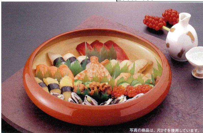
写真の商品は、尺0寸を使用しています。