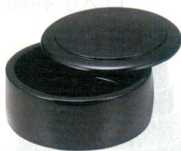
10-747-12 O-7-66 A D.Xタイコちらし桶 黒 ¥2,100 (16φ×9) 梱60