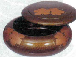
10-747-11 1-482-11 A S.D.Xちらし桶 梨地ツタ内梨地 ¥4,900 (19.8φ×8.6) 梱40