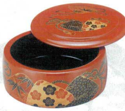
10-747-15 1-483-3 A D.Xタイコちらし桶 朱はまぐり ¥2,400 (16φ×9) 梱60