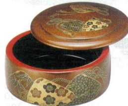
10-747-16 1-483-4 A D.Xタイコちらし桶 梨地はまぐり ¥2,400 (16φ×9) 梱60