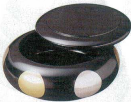
10-747-9 O-3-38 A S.D.Xちらし桶 黒日月 ¥4,000 (19.8φ×8.6) 梱40