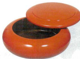
10-747-2 1-482-1 A S.D.Xちらし桶 朱内梨地 ¥2,200 (19.8φ×8.6) 梱40