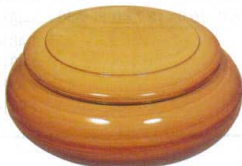
10-747-5 1-482-4 A S.D.Xちらし桶 花梨内黒 ¥2,850 (19.8φ×8.6) 梱40