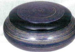
10-747-7 1-482-7 A S.D.Xちらし桶 紫金カスリ内黒 ¥3,050 (19.8φ×8.6) 梱40