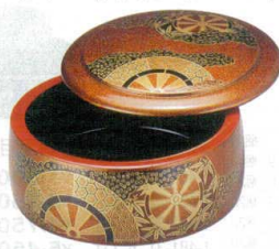
10-747-13 1-483-1 A D.Xタイコちらし桶 金梨地御所車 ¥2,400 (16φ×9) 梱60