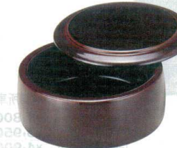
10-747-18 1-483-8 A D.Xタイコちらし桶 溜内漆調黒天溜底黒塗 S-S塗 ¥2,950 (16φ×9) 梱60