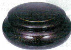
10-747-10 1-482-9 A S.D.Xちらし桶 黒シルク刷毛目内黒 エース塗 ¥4,200 (19.8φ×8.6) 梱40