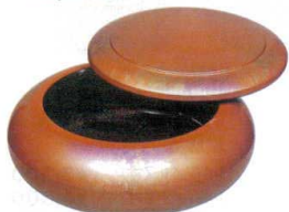
10-747-8 1-482-5 A S.D.Xちらし桶 金王八雲内梨地 ¥3,300 (19.8φ×8.6) 梱40