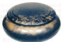
10-747-4 1-482-3 A S.D.Xちらし桶 青パール八雲内黒 ¥2,800 (19.8φ×8.6) 梱40