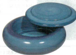
10-747-6 1-482-6 A S.D.Xちらし桶 新清流 ¥3,000 (19.8φ×8.6) 梱40