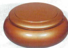
10-747-3 1-482-2 A S.D.Xちらし桶 金王内黒 ¥2,450 (19.8φ×8.6) 梱40