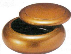
10-747-1 O-3-37 A S.D.Xちらし桶 梨地内黒 ¥2,200 (19.8φ×8.6) 梱40