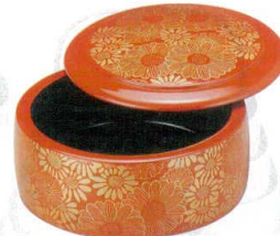
10-747-17 1-483-5 A D.Xタイコちらし桶 朱総菊 ¥2,400 (16φ×9) 梱60