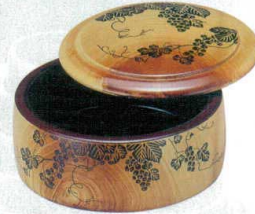
10-747-19 1-483-9 A D.Xタイコちらし桶 花梨ブドウ ¥3,050 (16φ×9) 梱60