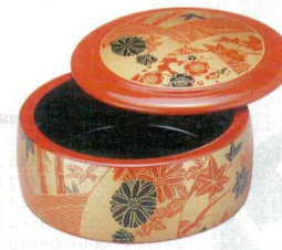
10-747-14 1-483-2 A D.Xタイコちらし桶 朱に扇面 ¥2,400 (16φ×9) 梱60