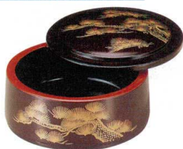
10-748-4 1-484-2 A D.X富士型ちらし桶 溜パール老松 ¥1,550 (16φ×8.5) 梱60