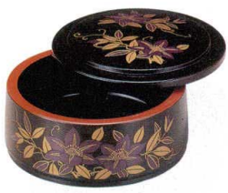
10-748-15 1-484-15 A D.X富士型ちらし桶 茶パール鉄仙 ¥1,750 (16φ×8.5) 梱60