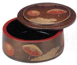
10-748-16 1-484-16 A D.X富士型ちらし桶 梨地蛇ノ目 ¥1,750 (16φ×8.5) 梱60