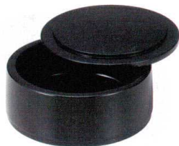
10-748-1 O-7-67 A D.X富士型ちらし桶 黒 ¥1,450 (16φ×8.5) 梱60