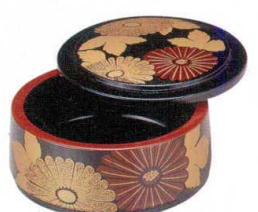
10-748-14 1-484-11 A D.X富士型ちらし桶 茶パール大菊 ¥1,700 (16φ×8.5) 梱60