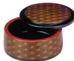
10-748-2 1-484-1 A D.X富士型ちらし桶 黒に菊詰 ¥1,450 (16φ×8.5) 梱60