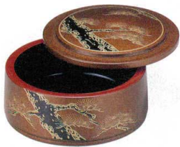
10-748-11 1-484-10 A D.X富士型ちらし桶 梨地黒松 ¥1,700 (16φ×8.5) 梱60