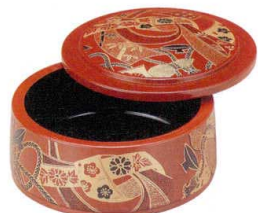
10-748-8 1-484-6 A D.X富士型ちらし桶 朱に結び ¥1,700 (16φ×8.5) 梱60