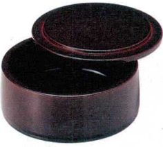
10-748-17 O-3-39 A D.X富士型ちらし桶 溜内漆調黒天溜底黒塗 S-S塗 ¥2,450 (16φ×8.5) 梱60