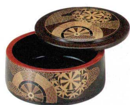
10-748-12 1-484-8 A D.X富士型ちらし桶 梨地御所車 ¥1,700 (16φ×8.5) 梱60