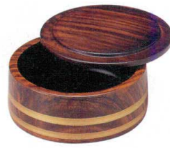
10-748-18 O-2-42 A D.X富士型ちらし桶 紫檀帯金内底黒塗 ¥3,800 (16φ×8.5) 梱60

S-S塗 ソフトでキズに対して復元力があり、汚れが付着しにくく、丈夫で器の艶も長く保ちます。