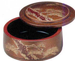
10-748-10 1-484-7 A D.X富士型ちらし桶 梨地赤松 ¥1,700 (16φ×8.5) 梱60