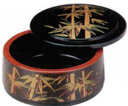
10-748-5 1-484-3 A D.X富士型ちらし桶 溜パール竹 ¥1,550 (16φ×8.5) 梱60