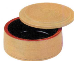
10-748-6 1-484-4 A D.X富士型ちらし桶 白木 ¥1,650 (16φ×8.5) 梱60