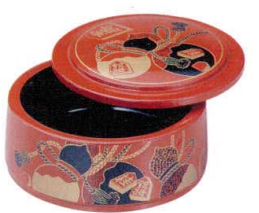
10-748-9 O-1-62 A D.X富士型ちらし桶 朱にひょうたん ¥1,700 (16φ×8.5) 梱60