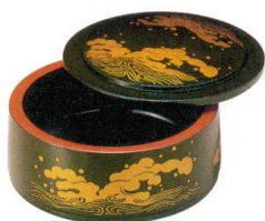
10-748-3 O-2-99 A D.X富士型ちらし桶 グリーンパール波 ¥1,450 (16φ×8.5) 梱60