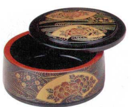
10-748-13 1-484-9 A D.X富士型ちらし桶 茶パール扇面 ¥1,700 (16φ×8.5) 梱60