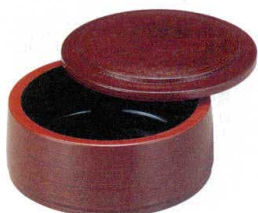
10-748-7 1-484-5 A D.X富士型ちらし桶 溜刷毛目 ¥1,700 (16φ×8.5) 梱60