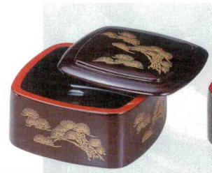
10-749-2 1-485-1 A D.X角ちらし桶 溜パール老松 ¥2,050 (15×15×8.5) 桶60