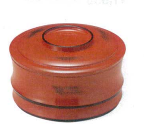
10-749-9 M竹型ちらし 根来帯黒 O-3-41 ¥2,000 (14.7φ×8.7) 桶60