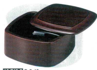
10-749-5 O-3-40 A D.X角ちらし桶 溜内漆調黒天溜底黒塗 S-S塗 ¥2,700 (15×15×8.5) 桶60