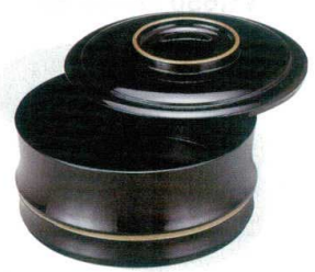
10-749-8 M竹型ちらし 溜金線 1-485-9 ¥1,700 (14.7φ×8.7) 桶60