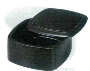
10-749-1 O-7-68 A D.X角ちらし桶 黒 ¥2,000 (15×15×8.5) 桶60