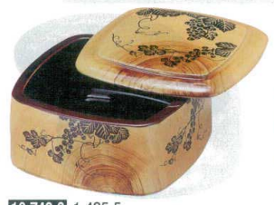
10-749-6 1-485-5 A D.X角ちらし桶 花梨ブドウ ¥3,150 (15×15×8.5) 桶60