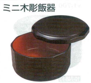
10-749-13 TA ミニ木彫飯器 溜内朱 W-3-20 ¥2,050 (13φ×8)