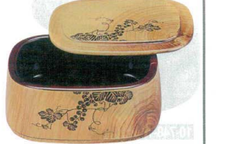
10-749-17 1-481-51 A D.X小判ちらし桶 花梨ブドウ ¥2,800 (15.9×12.7×7.2) 桶60