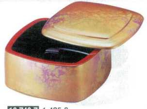
10-749-7 1-485-6 A D.X角ちらし桶 金王八雲 ¥3,200 (15×15×8.5) 桶60