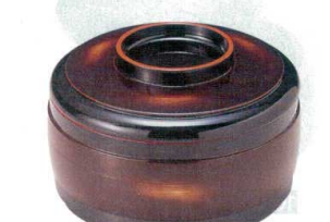
10-749-19 A糸巻丸重 タメ別甲 O-3-43 ¥2,350 (14.5φ×9.1) 桶60

S-S塗 ソフトでキズに対して復元力があり、汚れが付着しにくく、丈夫で器の艶も長く保ちます。