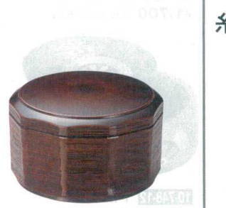
10-749-14 TA ミニ木彫飯器 栃 W-3-15 ¥2,150 (13φ×8)