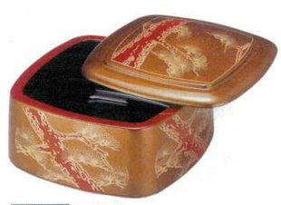
10-749-4 1-485-3 A D.X角ちらし桶 梨地赤松 ¥2,300 (15×15×8.5) 桶60