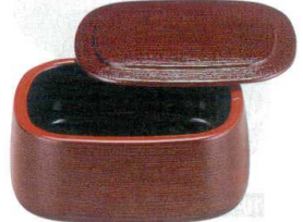
10-749-15 1-481-35 A D.X小判ちらし桶 溜刷毛目 ¥2,450 (15.9×12.7×7.2) 桶60