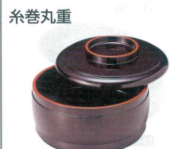
10-749-18 A糸巻丸重 タメパール天朱 O-3-42 ¥1,950 (14.5φ×9.1) 桶60