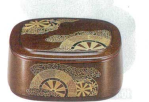
10-749-16 1-481-43 A D.X小判ちらし桶 梨地御所車 ¥2,700 (15.9×12.7×7.2) 桶60