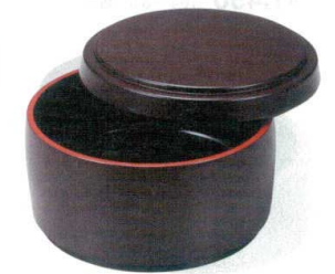
10-749-11 A太鼓丸重 艶消新溜 O-7-69 ¥2,000 (15φ×9.5) 桶60