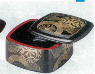
10-749-3 1-485-2 A D.X角ちらし桶 梨地御所車 ¥2,200 (15×15×8.5) 桶60