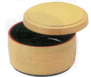
10-749-10 A太鼓丸重 白木塗 O-3-44 ¥2,000 (15φ×9.5) 桶60