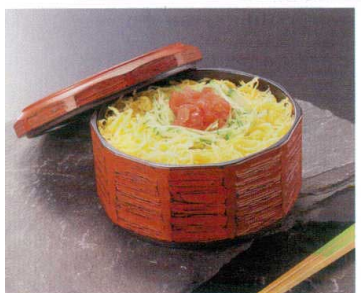
10-749-12 TA ミニ木彫飯器 根来 W-3-16 ¥2,350 (13φ×8)