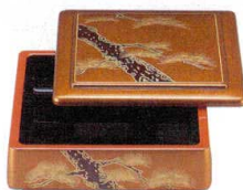
10-752-7 新角D.X桶 梨地赤松 1-490-3 A|オヤ ¥1,900 (20.5×20.5×6.2) 櫃40 1-490-3A M|フタ ¥1,500 (20.5×20.5×1.9) 櫃80