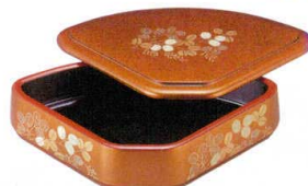
10-752-4 D.X扇面桶 梨地萩 1-491-5 A|オヤ ¥3,000 (28.8×19.3×6) 櫃60 1-491-5A M|フタ ¥2,150 (28.8×19.3×1.9) 櫃80