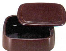
10-752-11 角D.X7寸桶 溜内漆調 黒天溜底黒塗 S・S塗 O-3-11 A|オヤ ¥2,350 (21×21×6.1) 櫃60 O-3-56 M|フタ ¥2,100 (21×21×1.8) 櫃80