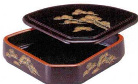
10-752-3 D.X扇面桶 溜パール老松 1-491-4 A|オヤ ¥2,700 (28.8×19.3×6) 櫃60 1-491-4A M|フタ ¥2,050 (28.8×19.3×1.9) 櫃80