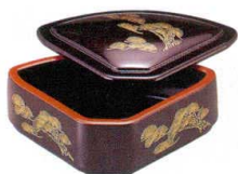
10-752-1 1-491-1 A|D.X扇面ちらし 溜パール老松 ¥2,850 (22.4×14.7×7) 櫃60