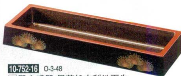
10-752-16 O-3-48 A|殿上盛器 黒若松内梨地天朱 ¥2,450 (41.5×14.5×7-内寸38×11.3×4.7) 櫃40