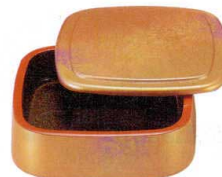
10-752-13 角D.X7寸桶 金王八雲内梨地 1-480-46 A|オヤ ¥2,700 (21×21×6.1) 櫃60 1-490-11A M|フタ ¥2,200 (21×21×1.8) 櫃80