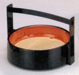
10-752-14 D.X手提鉢 黒内朱 1-698-19 A|本体 ¥6,300 (27φ×20.8) 櫃10 1-706-3A AP|スノ子 ¥1,350 (22.3φ) 櫃120