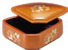
10-752-2 1-491-2 A|D.X扇面ちらし 梨地萩 ¥3,150 (22.4×14.7×7) 櫃60