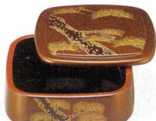
10-752-9 角D.X7寸桶 梨地赤松 1-480-19 A|オヤ ¥1,700 (21×21×6.1) 櫃60 1-490-6A M|フタ ¥1,850 (21×21×1.8) 櫃80