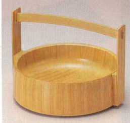
10-752-15 D.X手提鉢 白木 1-698-20 A|本体 ¥6,900 (27φ×20.8) 櫃10