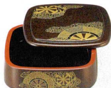
10-752-10 角D.X7寸桶 梨地御所車 1-480-10 A|オヤ ¥1,700 (21×21×6.1) 櫃60 1-490-7A M|フタ ¥1,850 (21×21×1.8) 櫃80