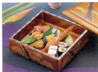
10-752-5 新角D.X桶 梨地赤松内金梨地天黒アジロ 1-490-5 A|オヤ ¥2,400 (20.5×20.5×6.2) 櫃40 1-490-3A M|フタ ¥1,500 (20.5×20.5×1.9) 櫃80