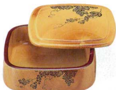
10-752-12 角D.X7寸桶 花梨ドノウ内花梨塗 1-480-37 A|オヤ ¥2,600 (21×21×6.1) 櫃60 1-490-10A M|フタ ¥2,100 (21×21×1.8) 櫃80