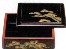
10-752-6 新角D.X桶 溜パール老松 1-490-1 A|オヤ ¥1,850 (20.5×20.5×6.2) 櫃40 1-490-1A M|フタ ¥1,500 (20.5×20.5×1.9) 櫃80