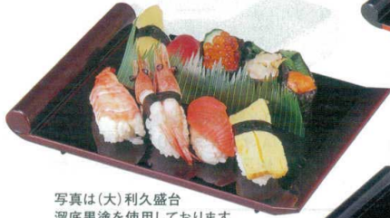
写真は(大)利久盛台 溜底黒塗を使用しております。

10-753-3 1-499-9 A (大)利久盛台 黒洩朱底黒塗 ¥2,950 (24.6×16.7×4.1) 櫃60