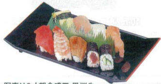
写真は9寸朝倉盛皿 黒洩朱 を使用しております。