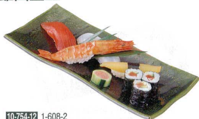
10-754-12 1-608-2 TA 9.5寸雄山盛皿 織部 クリーン塗 ¥4,150 (28.3×13×3) 櫃60