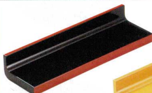
10-754-7 M-16-16 A 9寸L型付け台 黒測朱 ¥2,300 (26.9×8.2×4.3) 櫃80