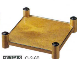
10-754-2 O-3-60 A 角水月皿 金雲天黒 ¥2,100 (17.6×17.6×4.9) 櫃60