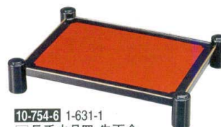
10-754-6 1-631-1 A 長手水月皿 朱天金 ¥2,400 (26.3×19.3×4.6) 櫃60