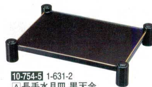
10-754-5 1-631-2 A 長手水月皿 黒天金 ¥2,250 (26.3×19.3×4.6) 櫃60