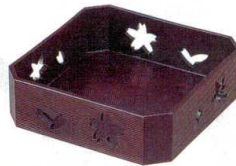
10-754-11 A 隅切透かし盛器 溜 1-627-4 ¥2,250 (18.2×18.2×5.8) 櫃60