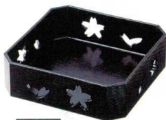
10-754-10 A 隅切透かし盛器 黒 M-1-23 ¥1,950 (18.2×18.2×5.8) 櫃200