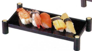
10-754-3 1-630-8 A 天平皿 黒天金 ¥1,850 (25.5×12.8×4.7) 櫃60