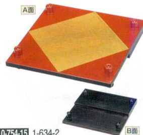
10-754-15 1-634-2 A D.Xひな段天皿 朱金箔/黒千筋 ¥6,100 (22×22×5) 櫃40

S-S塗 ソフトでキズに対して復元力があり、汚れが付着しにくく、丈夫で器の艶も長く保ちます。