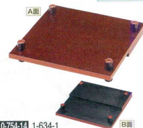
10-754-14 1-634-1 A D.Xひな段天皿 梨地/黒千筋 ¥3,350 (22×22×5) 櫃40