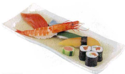
10-754-13 1-608-4 TA 9.5寸雄山盛皿 白唐津 ¥4,800 (28.3×13×3) 櫃60