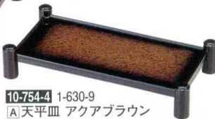
10-754-4 1-630-9 A 天平皿 アクアブラウン ¥2,250 (25.5×12.8×4.7) 櫃60