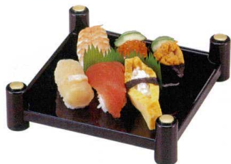
10-754-1 1-630-1 A 角水月皿 黒天金 ¥1,600 (17.6×17.6×4.9) 櫃60