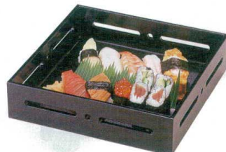
10-755-18 A 8寸角高型透かし盛器 黒 1-626-8 ¥2,100 (23.8×23.8×6.2) 櫃40