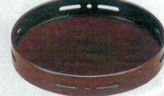
10-755-12 1-640-9 A 5.5寸丸透かし盛器 溜 S・S塗 ¥3,100 (20.3φ×3.6) 櫃40