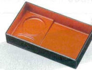
10-755-5 F-1-69 A平安箱 黒内朱 ¥1,450 (20.2×11.9×4.4) 櫃80