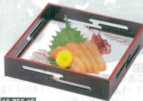
10-755-15 1-625-1 A 6寸角透かし盛器 黒天朱 ¥1,500 (17.8×17.8×4.3) 櫃60 1-625-8 陶6寸角透かし盛器用陶板 武蔵野 限定品 ¥3,400 (16.5×16.5×0.8) 櫃40