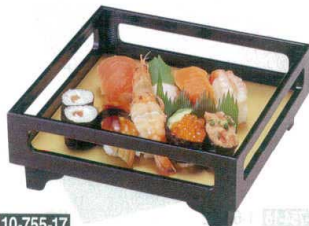
10-755-17 1-626-2 A 7寸角足付透かし盛器 黒 ¥2,850 (21×21×8.4) 櫃40 1-626-3 A 7寸角透かし盛器用中皿 朱千筋/金 ¥1,500 (19.5×19.5×0.3) 櫃100