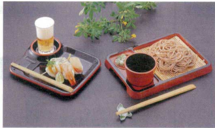
10-755-1 1-442-3 A立食パーティー皿 黒天朱 ¥935 (21.5×17.5×3) 櫃100 10-755-2 1-442-6 A宴パーティー皿 朱天黒 ¥1,350 (25.7×18.2×2) 櫃80

1-534-4A 竹(大)井桁ザル用竹ス ¥380 (14.8×14.8) 1-559-15 A/D.Xつゆ入れ 外朱天朱 ¥700 (8.8φ×6.3) 櫃200