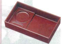
10-755-6 F-1-70 A平安箱 銀朱 ¥1,500 (20.2×11.9×4.4) 櫃80