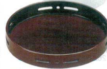
10-755-11 1-640-8 A 6.5寸丸透かし盛器 溜 S・S塗 ¥2,700 (19φ×3.3) 櫃50