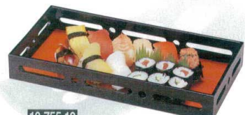
10-755-19 1-628-10 A 尺0寸長手透かし盛器 黒 ¥2,650 (29.8×14.8×4.8) 櫃60 1-628-14 A 尺0寸長手透かし盛器用中皿 朱/金 ¥2,400 (28.5×13.5×0.3) 櫃100

S・S塗 ソフトでズに対して復元力があり、汚れが付着しにくく、丈夫で器の艶も長く保ちます。