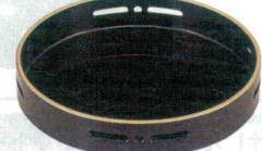
10-755-9 1-640-6 A 7寸丸透かし盛器 黒天金 ¥1,650 (20.3φ×3.6) 櫃40