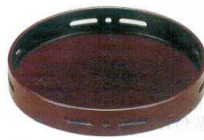
10-755-10 1-640-7 A 5.5寸丸透かし盛器 溜 S・S塗 ¥2,400 (17φ×3.2) 櫃60