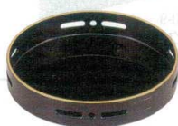
10-755-7 1-640-4 A 5.5寸丸透かし盛器 黒天金 ¥1,450 (17φ×3.2) 櫃60