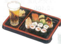
10-755-4 宴パーティー皿 1-442-7 A黒天朱 ¥1,350 (25.7×18.2×2) 櫃80