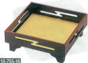
10-755-16 1-625-3 A 6寸角足付透かし盛器 黒天朱 ¥2,300 (17.8×17.8×7.1) 櫃60 1-625-6 A 6寸角透かし盛器用中皿 朱/金 ¥1,300 (16.8×16.8×0.3) 櫃200