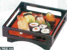
10-755-14 1-624-1 A 5.5寸日野盛器 黒 ¥2,000 (16.8×16.8×6.5) 櫃60 1-624-3 A 日野盛器用中皿 金/朱 ¥1,050 (15.3×15.3×0.3) 櫃200