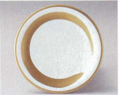
10-764-9 O-4-38 TA 寿司皿 金一筆 ¥640