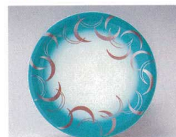
10-764-16 O-4-15 TA 寿司皿 エメラルド風車 ¥790