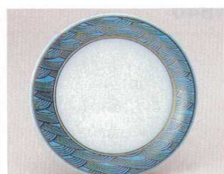
10-764-28 O-71-14 TA 寿司皿 青磁波 ¥980