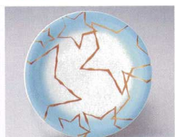
10-764-23 O-4-21 TA 寿司皿 青磁雅 ¥790