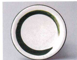
10-764-6 O-4-35 TA 寿司皿 グリーン一筆 ¥640