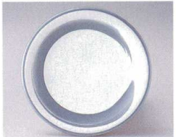
10-764-8 O-4-37 TA 寿司皿 シルバー一筆 ¥640