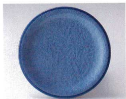
10-764-1 O-4-41 TA 寿司皿 アクアブルー測塗 ¥580