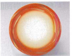
10-764-25 O-4-25 TA 寿司皿 ブラウンのし ¥790