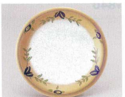
10-764-30 O-73-16 TA 寿司皿 ゴールド椿 ¥1,000