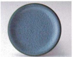
10-764-3 O-4-44 TA 寿司皿 アクアグリーン測塗 ¥580