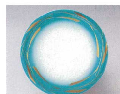
10-764-26 O-4-26 TA 寿司皿 エメラルドのし ¥790