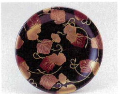
10-764-19 O-70-13 TA 寿司皿 黒に二色ツタ ¥980