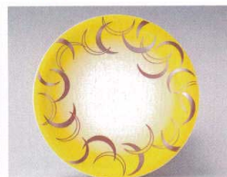
10-764-17 O-4-16 TA 寿司皿 イエロー風車 ¥790