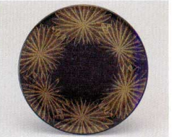
10-764-10 1-506-10 TA 寿司皿 大菊 ¥800