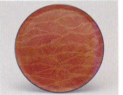
10-764-15 1-506-15 TA 寿司皿 朱金波 ¥900