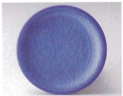
10-764-2 O-4-43 TA 寿司皿 アクアパープル測塗 ¥580