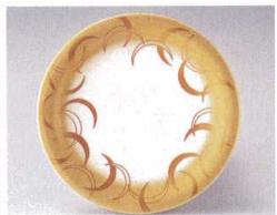
10-764-18 O-4-18 TA 寿司皿 ゴールド風車 ¥820