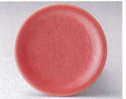
10-764-4 O-4-45 TA 寿司皿 アクアピンク測塗 ¥580