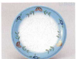
10-764-29 O-73-9 TA 寿司皿 青磁椿 ¥990