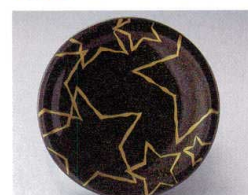
10-764-21 O-4-19 TA 寿司皿 黒パール雅 ¥750