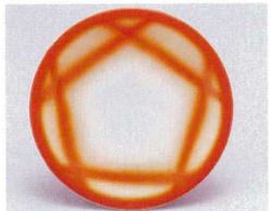
10-764-13 O-1-75 TA 寿司皿 ブラウン格子 ¥730