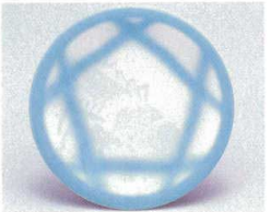
10-764-14 O-1-77 TA 寿司皿 青磁格子 ¥730