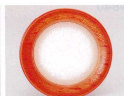
10-764-27 O-71-13 TA 寿司皿 赤波 ¥840