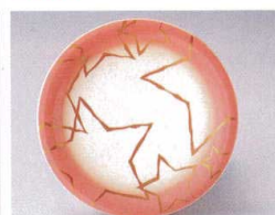
10-764-22 O-4-20 TA 寿司皿 ピンク雅 ¥790