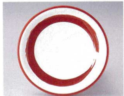
10-764-7 O-4-36 TA 寿司皿 朱一筆 ¥640