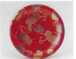
10-764-20 O-70-14 TA 寿司皿 朱に二色ツタ ¥1,100