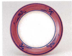
10-764-12 O-73-18 TA 寿司皿 ワインかきつばた ¥700