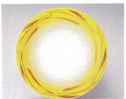
10-764-24 O-4-24 TA 寿司皿 イエローのし ¥790