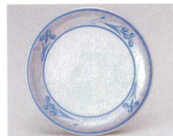
10-764-11 O-73-20 TA 寿司皿 シルバーかきつばた ¥770