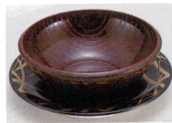
10-772-17 1-512-22 A(小)サラダボール 溜 ¥650 (13φ×4.2) 梱160