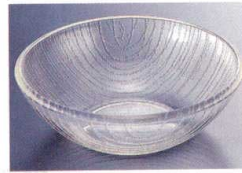
10-772-18 1-512-23 AC(小)サラダボール 透明 ¥900 (13φ×4.2) 梱160