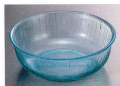
10-772-15 1-512-28 AC4.5寸ケヤキサラダ鉢 ブルー ¥1,290 (13.4φ×4.6) 梱160