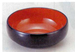
10-772-11 1-328-9 A4寸丸鉢 朱天黒(段付) ¥500 (11.5φ×4.2) 梱200