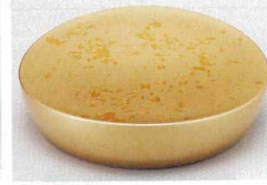
10-772-7 O-5-99 A永楽皿 色紙金箔S-H塗 底N.S加工 ¥1,230 (12φ×3)