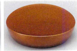
10-772-5 O-5-96 A永楽皿 梨地 底N.S加工 ¥720 (12φ×3)