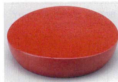
10-772-4 O-5-95 A永楽皿 朱石目 底N.S加工 ¥720 (12φ×3)