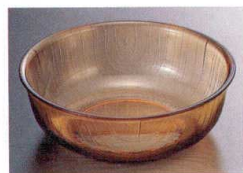
10-772-16 1-512-29 AC4.5寸ケヤキサラダ鉢 ブラウン ¥1,290 (13.4φ×4.6) 梱160