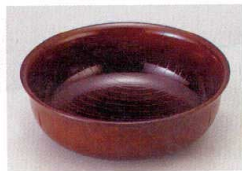
10-772-12 Aケヤキサラダ鉢 溜 1-512-26 4.5寸 ¥810 (13.4φ×4.6) 梱160 1-771-2 5寸 ¥950 (14.9φ×4.6) 梱100