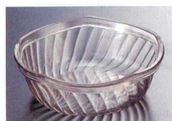
10-772-10 1-512-1 AC波鉢 ¥950 (12.7φ×4.4) 梱200