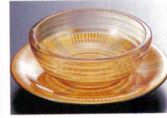
10-772-19 AC千筋鉄鉢 ブラウン 1-550-2 4寸 ¥1,100 (11.4φ×4) 梱200 1-550-3 4.5寸 ¥1,200 (13.3φ×4.2) 梱160