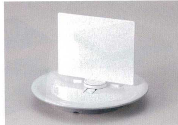
10-772-2 寿司皿PRスタンド白塗(寿司皿付) O-7-24 ¥2,000 (15φ×10.6)