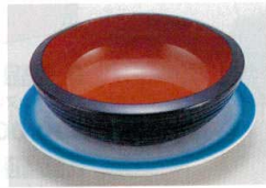
10-772-13 A千筋鉄鉢 外黒塗内朱天黒 1-548-1 4寸 ¥700 (11.4φ×4) 梱200 1-548-2 4.5寸 ¥800 (13.3φ×4.2) 梱160