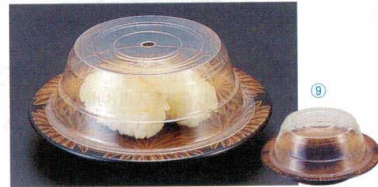
10-772-8 PET回転寿司皿用 蓋A 1-507-16 (内寸11.7φ×4.4・厚み0.8mm) 梱1,000 1枚 ¥125 (1袋) 100枚 ¥12,500