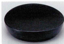
10-772-3 O-5-94 A永楽皿 黒石目 底N.S加工 ¥720 (12φ×3)

寿司や、さしみを永楽皿に載せることで豪華に、またボリュームタップリに演出する事が出来ます。寿司皿の上に乗せて高級感を演出します。