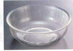
10-772-14 1-512-27 AC4.5寸ケヤキサラダ鉢 透明 ¥890 (13.4φ×4.6) 梱160