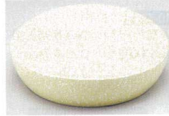
10-772-6 O-5-98 A永楽皿 新唐津塗 底N.S加工 ¥790 (12φ×3)