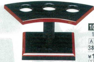
10-775-1 1-515-1 A 手巻きすし立て 3本用 黒淵朱 ¥1,350 (17.8×8×8.3) 幅60