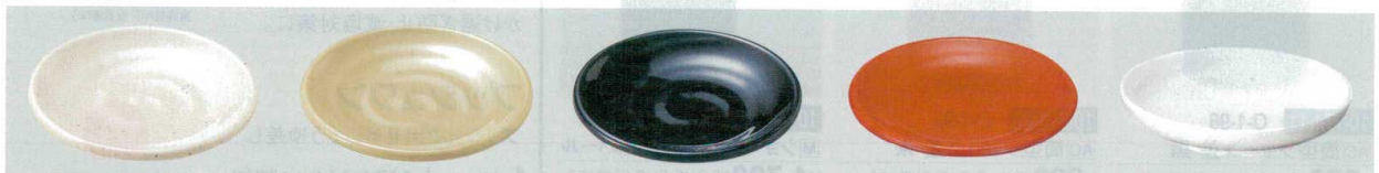
10-775-6 K-6-4-3 M (K-JW-6) 小皿 粉引 ¥300 (9.6φ×1.3) 幅250