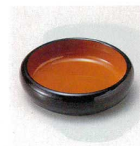
10-776-21 O-3-90 A タイコ型のぞき(小) 黒内朱 ¥480 (8.8φ×2.4) 梱200