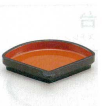
10-776-31 1-510-13 A 扇面タレ入れ 朱天黒 ¥650 (13.3×8.7×2.5) 梱200