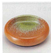
10-776-28 1-510-8 A D.Xタイコ型のぞき 若草織部 ¥800 (9.5φ×2.5) 梱200