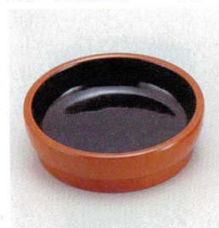
10-776-9 1-559-21 A D.X竹型タレ入れ 黒内黒 ¥450 (8φ×2.5) 梱200