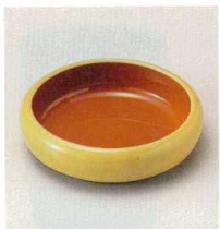
10-776-23 O-3-92 A タイコ型のぞき(小) クリーム内朱 ¥530 (8.8φ×2.4) 梱200