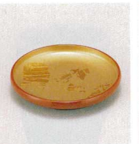
10-776-19 1-464-40 A 一休タレ入れ 色紙金箔測朱 S-H塗 ¥900 (9φ×1.6) 梱200