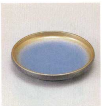
10-776-17 1-464-16 A 一休タレ入れ ブルー真珠測金 ¥700 (9φ×1.6) 梱200