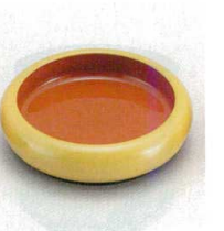
10-776-26 1-510-5 A D.Xタイコ型のぞき クリーム内朱 ¥550 (9.5φ×2.5) 梱200