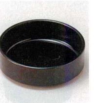
10-776-14 O-3-89 A 3寸ク口目タレ入れ 溜 ¥450 (9φ×2.7) 梱300