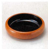
10-776-22 O-3-91 A タイコ型のぞき(小) 朱内黒 ¥480 (8.8φ×2.4) 梱200