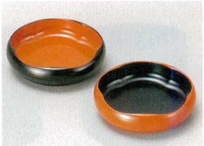
10-776-6 1-511-17 A 錦のぞき皿 金雅外朱 ¥900 (8.6φ×2.2) 梱300