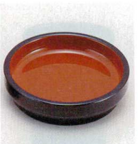
10-776-11 1-510-3 A D.Xタレ入れ 朱内黒 ¥480 (9.4φ×2.4) 梱200