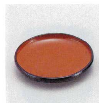
10-776-15 1-464-8 A 一休タレ入れ 黒内朱 ¥400 (9φ×1.6) 梱200