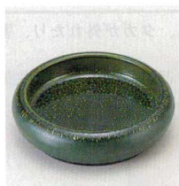
10-776-29 1-510-9 A D.Xタイコ型のぞき 織部 ¥800 (9.5φ×2.5) 梱200