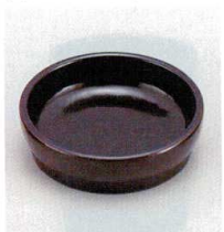
10-776-10 1-559-23 A D.X竹型タレ入れ 溜 ¥500 (8φ×2.5) 梱200