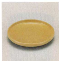
10-776-16 1-464-24 A 一休タレ入れ 白木 ¥500 (9φ×1.6) 梱200