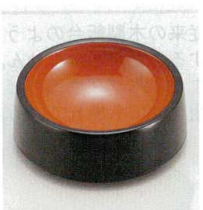
10-776-30 1-510-17 A D.Xのぞき 黒刷毛目内朱 ¥900 (9.7φ×3.7) 梱150