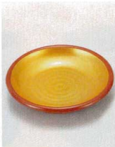
10-776-4 1-511-20 A 錦のぞき皿 織部 ¥500 (8φ×1.6) 梱300