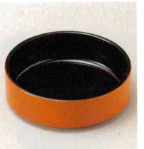
10-776-12 O-3-87 A 3寸ク口目タレ入れ 朱内黒 ¥400 (9φ×2.7) 梱300