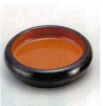
10-776-24 1-510-4 A D.Xタイコ型のぞき 黒内朱 ¥490 (9.5φ×2.5) 梱200