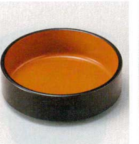
10-776-13 O-3-88 A 3寸ク口目タレ入れ 黒内朱天黒 ¥400 (9φ×2.7) 梱300