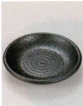
10-776-3 1-511-19 A 錦のぞき皿 青磁 ¥500 (8φ×1.6) 梱300