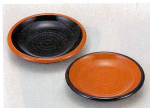
10-776-1 1-511-21 A 錦のぞき皿 黒天朱 ¥400 (8φ×1.6) 梱300