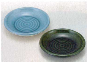
10-776-2 1-511-22 A 錦のぞき皿 朱天黒 ¥400 (8φ×1.6) 梱300