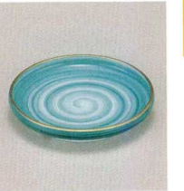
10-776-20 1-464-48 A 一休タレ入れ 清流天金 ¥950 (9φ×1.6) 梱200