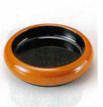
10-776-25 O-3-93 A D.Xタイコ型のぞき 朱内黒 ¥490 (9.5φ×2.5) 梱200