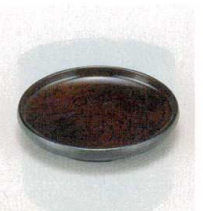
10-776-18 1-464-32 A 一休タレ入れ 樺木目 ¥750 (9φ×1.6) 梱200