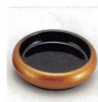
10-776-27 1-510-6 A D.Xタイコ型のぞき 梨地内黒 ¥600 (9.5φ×2.5) 梱200