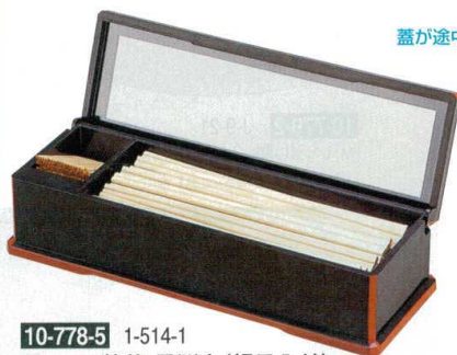
10-778-5 1-514-1 A)ニュー箸箱 黒瀾朱(楊子入付) ¥2,800 (27.5×10×7.2) 梱40