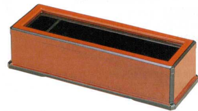
10-778-7 O-6-1 A)ニュー箸箱 朱瀾黒(楊子入付) ¥2,900 (27.5×10×7.2) 梱40