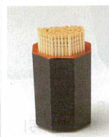
10-778-12 1-514-14 A)八角妻楊子入れ 黒天朱 ¥500 (4×4×5.6) 梱200