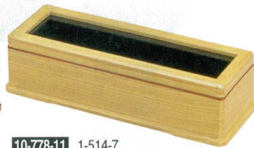
10-778-11 1-514-7 A)新箸箱 白木(楊子入無し) ¥3,500 (28×10×7.3) 梱40