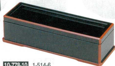
10-778-10 1-514-6 A)新箸箱 黒瀾朱(楊子入無し) ¥3,300 (28×10×7.3) 梱40

[新箸箱] ユーザーの要望にお応えし、はしのみを入れる本格的な箸箱です。 (内寸26×7.9cm)