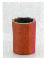
10-778-13 1-514-15 A)八角妻楊子入れ ワインパール天朱 ¥520 (4×4×5.6) 梱200