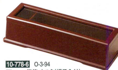
10-778-6 O-3-94 A)ニュー箸箱 ウルミ(楊子入付) ¥2,900 (27.5×10×7.2) 梱40

クリーンフードを付けることにより、割箸や楊子の先端に触れぬ様ガードしますので、衛生的です。