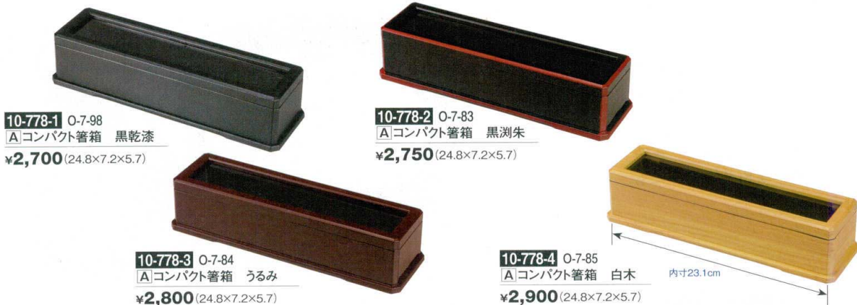
10-778-1 O-7-98 A)コンパクト箸箱 黒乾漆 ¥2,700 (24.8×7.2×5.7)

カウンター席でも使いやすい幅狭タイプ。(※奥行7.2cm) 23cmの箸が入ります。