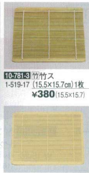
10-781-3 竹スー 1-519-17 (15.5×15.7cm) 1枚 ¥380 (15.5×15.7)