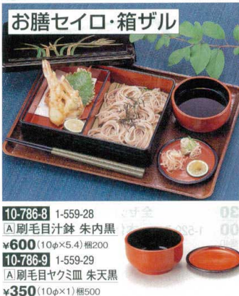
お膳セイロ・箱ザル