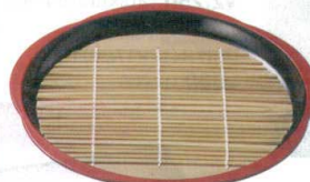
10-791-2 段付丸そば皿(小) 朱測黒 S-10-6 [A] 本体 ¥1,500 (21.7φ×2.9) 梱80 S-10-30 竹竹ス(16.5φ)1枚 ¥650 (16.5φ) S-10-19 P.P.P.測付丸竹ス ライトグリーン16.5φ ¥400 (16.5φ)