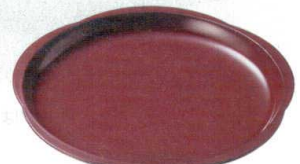
10-791-7 梅型そば皿 黒測朱 S-9-99 [A] 本体 ¥850 (23.3φ×2.3) 梱80 1-536-1B 竹竹ス(19.5φ)1枚 ¥380 (19.5φ) S-10-50 P.P.P.測付クリーム竹ス19.6φ丸 ¥400 (19.6φ)