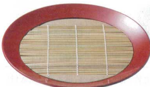
10-791-8 梅型そば皿 銀朱 S-10-1 [A] 本体 ¥900 (23.3φ×2.3) 梱80 1-536-1B 竹竹ス(19.5φ)1枚 ¥380 (19.5φ) S-10-50 P.P.P.測付クリーム竹ス19.6φ丸 ¥400 (19.6φ)