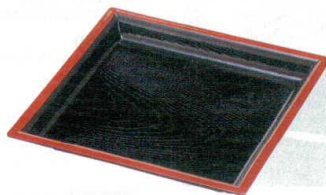
10-791-14 7寸角高台お好み皿 枳刷毛目 S-10-2 [A] 本体 ¥2,000 (21×21×3) 梱80 1-532-1A 竹竹ス(17×17cm)1枚 ¥380 S-10-47 P.P.P.測付クリーム竹ス 17cm角 ¥390 (17×17)