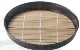
10-791-5 7寸刷毛目丸そば皿 総黒塗 S-9-97 [A] 本体 ¥1,000 (22.3×3.5) 梱80 1-536-1B 竹竹ス(19.5φ)1枚 ¥380 (19.5φ) S-10-50 P.P.P.測付クリーム竹ス19.6φ丸 ¥400 (19.6φ)