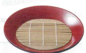
10-791-9 S-10-17 [A] 7寸羽反盛皿 新黒石目 ¥1,050 (21.5φ×2.8) 梱80