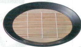
10-791-1 段付丸そば皿(小) 黒測朱 S-10-4 [A] 本体 ¥1,500 (21.7φ×2.9) 梱80 S-10-30 竹竹ス(16.5φ)1枚 ¥650 (16.5φ) S-10-19 P.P.P.測付丸竹ス ライトグリーン16.5φ ¥400 (16.5φ)