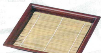
10-791-15 7寸角木目そば皿 黒天朱(底板付) 1-535-5 [A] 本体 ¥850 (21.1×21.1×2.6) 1-532-1A 竹竹ス(17×17cm)1枚 ¥380 (17×17)