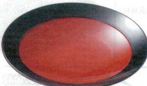
10-791-3 段付丸そば皿(大) 黒測朱 S-10-5 [A] 本体 ¥1,750 (25.5φ×3.8) 梱80 1-536-1B 竹竹ス(19.5φ)1枚 ¥380 (19.5φ) S-10-50 P.P.P.測付クリーム竹ス 19.6φ丸 ¥400 (19.6φ)