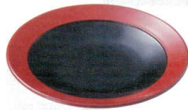
10-791-6 7寸刷毛目丸そば皿 総新溜塗 S-9-98 [A] 本体 ¥1,050 (22.3×3.5) 梱80 1-536-1B 竹竹ス(19.5φ)1枚 ¥380 (19.5φ) S-10-50 P.P.P.測付クリーム竹ス19.6φ丸 ¥400 (19.6φ)