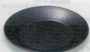
10-791-4 段付丸そば皿(大) 朱測黒 S-10-7 [A] 本体 ¥1,750 (25.5φ×3.8) 梱80 1-536-1B 竹竹ス(19.5φ)1枚 ¥380 (19.5φ) S-10-50 P.P.P.測付クリーム竹ス 19.6φ丸 ¥400 (19.6φ)