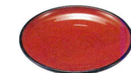
10-792-19 24cm多用皿 白木塗 S-8-19 [A] 本体 ¥1,500 (24.3φ×4) 黒60 1-536-1B 竹竹ス(19.5φ)1枚 ¥380 (19.5φ)