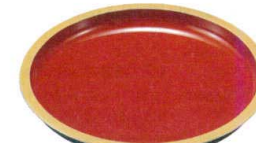
10-792-11 樽型そば皿 白木帯金(底板付) S-9-71 [A] 本体 ¥2,050 (21.2φ×3.4) S-10-50 P.P.P.滑付クリアム竹ス 19.6φ 丸 ¥400 (19.6φ)