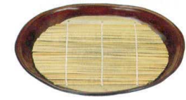
10-792-14 大盛瀾太そば皿 朱天白木 S-8-21 [A] 本体 ¥900 (25.2φ×3.2) 黒60 1-536-1B 竹竹ス(19.5φ)1枚 ¥380 (19.5φ)