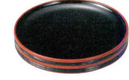
10-792-7 名月そば皿 朱瀾黒 1-537-5 [A] 本体 ¥1,200 (22.8φ×2.6) 黒80 1-536-1B 竹竹ス(19.5φ)1枚 ¥380 (19.5φ)