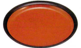
10-792-6 8寸丸刷毛目そば皿 栃塗(底板付) S-9-66 [A] 本体 ¥1,000 (23.5φ×3) 1-536-1B 竹竹ス(19.5φ)1枚 ¥380 (19.5φ)