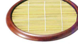
10-792-3 7.5寸羽反そば皿 黒木目天朱 S-9-44 [A] 本体 ¥850 (22.2φ×3) 1-536-1B 竹竹ス(19.5φ)1枚 ¥380 (19.5φ)