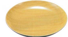
10-792-18 みやこ丸盛皿 朱天黒 M-8-16 [A] 本体 ¥1,300 (24.3φ×2.9) 黒80 1-536-1B 竹竹ス(19.5φ)1枚 ¥380 (19.5φ)