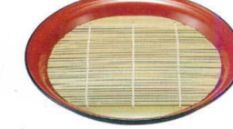
10-792-15 白山そば皿 栃 S-7-43 [A] 本体 ¥1,000 (24.3φ×2.7×3.4) 黒80 1-536-1B 竹竹ス(19.5φ)1枚 ¥380 (19.5φ)