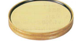
10-792-10 樽型そば皿 朱帯黒(底板付) S-9-70 [A] 本体 ¥1,700 (21.2φ×3.4) 1-536-1B 竹竹ス(19.5φ)1枚 ¥380 (19.5φ)