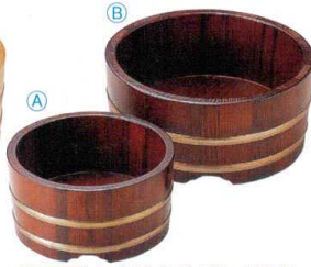
10-798-2 木製そば・うどん桶 茶木目 A M-13-34 6寸 ¥7,700 (18φ×9.5) 桶10 B M-13-35 7寸 ¥8,400 (21φ×9.5) 桶10