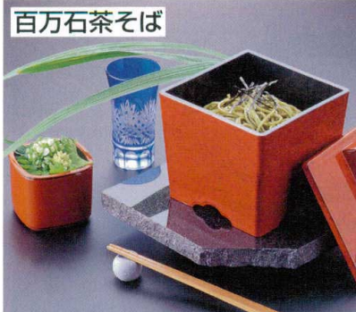
10-798-11 1-554-8 A 百万石茶そば入れ 溜 (スノ子付) ¥3,200 (12.9×12.9×13.2) 桶60