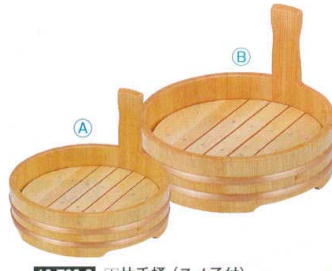
10-798-3 木片手桶 (スノ子付) A 1-741-5 6寸 ¥10,600 (18φ×14.8) 桶10 B 1-741-6 7寸 ¥12,300 (21φ×15.2) 桶10