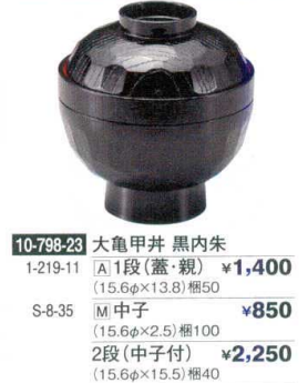
10-798-23 大亀甲井 黒内朱 1-219-11 A 1段 (蓋・親) ¥1,400 (15.6φ×13.8) 桶50 S-8-35 M 中子 ¥850 (15.6φ×2.5) 桶100 2段 (中子付) ¥2,250 (15.6φ×15.5) 桶40