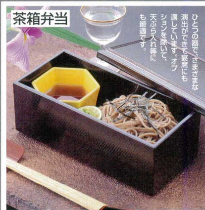
10-798-17 1-554-1 A 茶箱弁当 黒天朱 (オプション別) ¥2,200 (21.5×10.5×8) 桶60