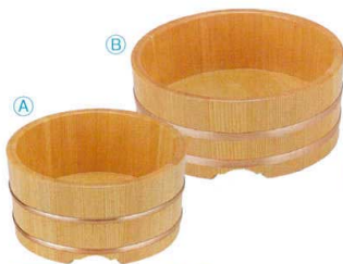
10-798-1 木製そば・うどん桶 A 1-741-3 6寸 ¥7,700 (18φ×9.5) 桶10 B 1-741-4 7寸 ¥8,400 (21φ×9.5) 桶10