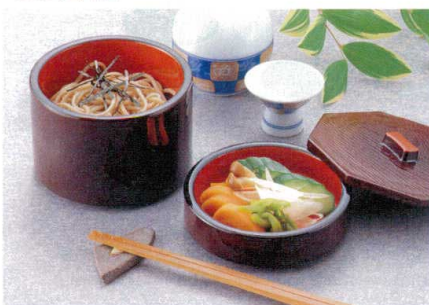
10-798-21 A 3寸武蔵野椀 黒刷毛目内朱 1-229-1 1段 (蓋・下段) ¥1,500 (11φ×8) 桶80 1-229-2 中段 (10.1φ×2.6) 桶200 2段セット ¥2,100 (11φ×9.5・内寸8φ×6.1) 桶60