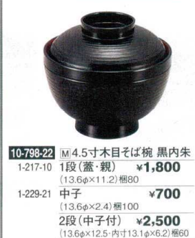
10-798-22 M 4.5寸木目そば椀 黒内朱 1-217-10 1段 (蓋・親) ¥1,800 (13.6φ×11.2) 桶80 1-229-21 中子 ¥700 (13.6φ×2.4) 桶100 2段 (中子付) ¥2,500 (13.6φ×12.5・内寸13.1φ×6.2) 桶60