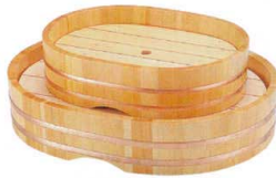
10-798-6 木製小判桶 (スノ子付) 1-737-12 (小) ¥16,500 (24×18×6) 桶8 1-737-13 (中) ¥28,500 (36×28×9) 桶6 1-737-14 (大) ¥34,800 (45×33×9) 桶4