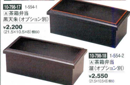
10-798-18 1-554-2 A 茶箱弁当 溜 (オプション別) ¥2,550 (21.5×10.5×8) 桶60