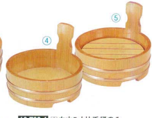
10-798-4 杵白木5寸片手桶のみ 1-741-10 ¥7,850 (14.5φ×11.9) 桶15 10-798-5 杵白木5寸片手桶 (スノ子付) 1-741-11 ¥8,900 (14.5φ×11.9) 桶15