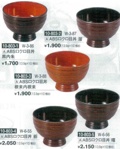
10-803-2 W-3-87 A ABS口口目井 溜 ¥1,900 (13.9φ×10) 楕80