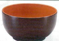
10-803-17 S-8-50 A どっしり椀 新溜内朱 ¥700 (16.3φ×8) 楕100