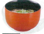
10-803-10 1-192-2 A 姫井 朱内黒 ¥470 (12.3φ×7.9) 楕200