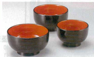
10-803-6 A 泉寿丼 黒内朱 S-7-47 4.3寸 ¥1,100 (12.9φ×8.5) 楕80 S-7-48 5寸 ¥1,300 (15.2φ×8.6) 楕80 S-7-49 5.4寸 ¥1,400 (16.3φ×9) 楕60