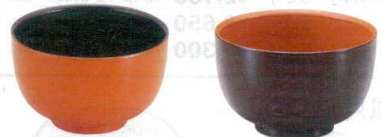
10-803-8 1-192-1 A 小町井 朱内黒 ¥470 (13.2φ×8.1) 楕200