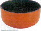
10-803-12 1-192-3 A 4寸井 朱内黒 ¥470 (12.8φ×6.4) 楕200