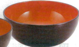
10-803-22 1-546-15 A 8寸大鉢 黒刷毛目内朱 ¥2,000 (23.9φ×10.5) 楕40