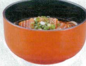
10-803-14 1-192-4 A 5寸井 朱内黒 ¥530 (14.4φ×7.3) 楕200