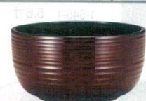
10-803-18 1-546-22 A 4.7寸四季井 うるみ千筋内黒 ¥780 (14.1φ×7.2) 楕120