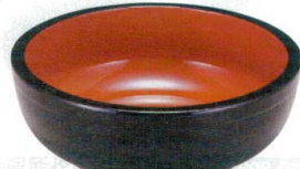
10-803-23 1-546-37 A 8.5寸ジャンボ麵鉢 黒内朱 ¥3,000 (25.1φ×8.4) 楕40