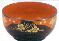
10-803-16 1-192-5 A どっしり椀 正方寺 ¥700 (16.3φ×8) 楕100