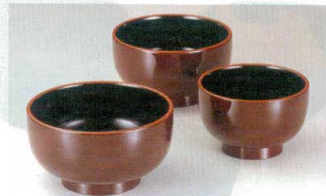
10-803-7 A 泉寿丼 うるみ内黒 S-8-94 4.3寸 ¥1,300 (12.9φ×8.5) 楕80 S-8-95 5寸 ¥1,550 (15.2φ×8.6) 楕80 S-8-96 5.4寸 ¥1,700 (16.3φ×9) 楕60