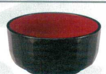
10-803-19 W-11-13 A 4.8寸亀甲木目井 黒内朱 ¥700 (14.4φ×7) 楕100