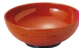
10-806-6 S-9-1 A 四季ラーメン鉢 根来 ¥1,700 (18.4φ×6.8・980cc) 梱100