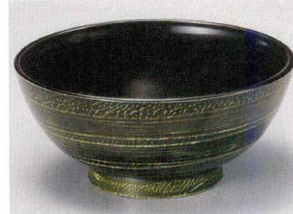
10-806-13 W-17-86 A ラーメン丼 緑に白流し 内黒 ¥2,150 (19.5φ×8.7・900cc) 梱100