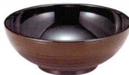
10-806-5 1-546-31 A 四季ラーメン鉢 うるみ千筋内黒 ¥1,050 (18.4φ×6.8・980cc) 梱100