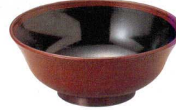
10-806-10 S-9-3 A 羽反ラーメン丼(中) 溜根毛目 ¥2,150 (18.8φ×7.6・1,000cc) 梱100