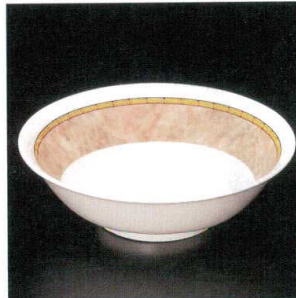
10-806-16 J-3-94 限定品 M (RB-1-200-1) ラーメン丼 ロイヤルマーブル ¥1,080 (19.7φ×6.1) 梱60