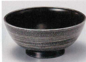
10-806-12 W-17-85 A ラーメン丼 黒に白流し 内黒 ¥2,150 (19.5φ×8.7・900cc) 梱100