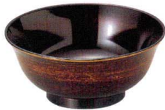
10-806-8 S-8-99 A 羽反ラーメン丼(小) 茶金かすり ¥1,650 (15φ×6.5・400cc) 梱120