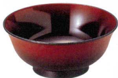
10-806-7 S-8-98 A 羽反ラーメン丼(小) 溜曙 ¥1,350 (15φ×6.5・400cc) 梱120