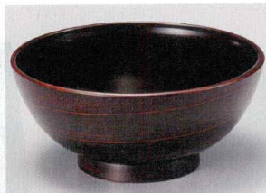
10-806-11 W-17-84 A ラーメン丼 溜根来 内黒 ¥2,150 (19.5φ×8.7・900cc) 梱100