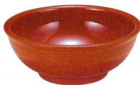
10-806-1 1-546-35 M 乱筋ラーメン鉢 朱塗 ¥2,150 (21.3φ×8.3・1,000cc) 梱50