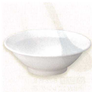
10-806-14 J-8-98 M (W-179) 8寸麺丼 アイボリー ¥1,150 (21.7φ×7.3) 梱60