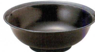
10-806-2 S-9-5 M 羽反ラーメン丼(大) 黒刷毛目天目 ¥3,000 (21φ×7.5・1,200cc) 梱80