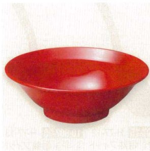
10-806-15 J-8-99 M (W-179R) 8寸麺丼 赤 ¥1,150 (21.7φ×7.3) 梱60