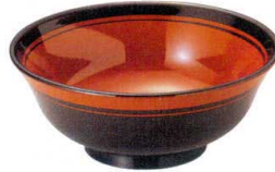
10-806-9 S-9-2 A 羽反ラーメン丼(中) 黒内朱ライン ¥1,500 (18.8φ×7.6・1,000cc) 梱100