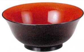
10-806-3 1-546-26 A 漉布目ラーメン鉢 黒内朱 ¥950 (19.9φ×8.4・1,050cc) 梱100