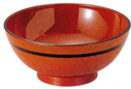
10-806-4 S-9-6 A ラーメン丼 朱 黒ライン ¥1,350 (19.5φ×8.7・900cc) 梱100