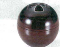
10-811-19 A 源氏椀 溜 W-4-67 オヤ・フタ ¥1,950 (9.8φ×10.3) S-8-34 中子のみ ¥500