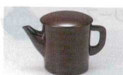
10-811-4 1-556-7 A (小) ゆとう 黒 (300cc) ¥1,450 (9φ×9.5) 櫃100