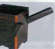
10-811-13 1-556-12 A (大) 角ゆとう 朱 (620cc) ¥3,450 (10.8×10.8×12.8) 櫃40