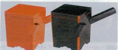
10-811-12 1-556-11 A (小) 角ゆとう 黒朱 (350cc) ¥3,400 (9×9×10) 櫃60