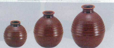
10-811-22 A とっくりダシ入れ 溜刷毛目 1-556-17 小 ¥1,430 (7φ×7.5×170cc) 櫃100 1-556-18 中 ¥1,880 (10φ×11.5×450cc) 櫃80 1-556-19 大 ¥2,250 (11.5φ×14×770cc) 櫃60