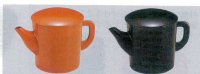
10-811-2 1-556-2 A ミニゆとう 黒朱 (150cc) ¥1,430 (7.5φ×8) 櫃100