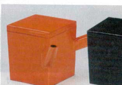
10-811-14 1-556-13 A (大) 角ゆとう 黒朱 (620cc) ¥3,700 (10.8×10.8×12.8) 櫃40