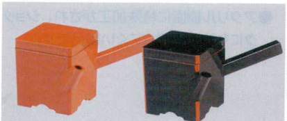
10-811-11 1-556-10 A (小) 角ゆとう 朱 (350cc) ¥2,950 (9×9×10) 櫃60