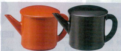
10-811-6 1-556-9 A (大) ゆとう 黒 (500cc) ¥2,300 (10.6φ×10.1) 櫃80