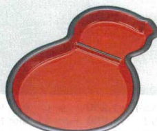
10-811-17 S-9-53 M ひさご仕切皿 朱天黒 ¥1,500 (27.6×19.1×2.4) 櫃80