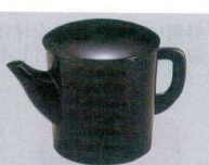
10-811-3 1-556-6 A (小) ゆとう 朱 (300cc) ¥1,450 (9φ×9.5) 櫃100