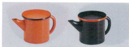
10-811-1 1-556-1 A ミニゆとう 朱黒 (150cc) ¥1,430 (7.5φ×8) 櫃100