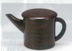
10-811-8 S-9-35 A (特大) ゆとう 黒 (540cc) ¥3,200 (10.8φ×11.5) 櫃80