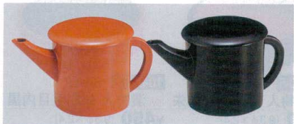
10-811-5 1-556-8 A (大) ゆとう 朱 (500cc) ¥2,300 (10.6φ×10.1) 櫃80