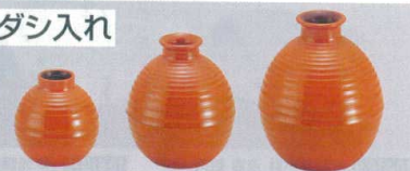
10-811-21 A とっくりダシ入れ 朱 1-556-14 小 ¥680 (7φ×7.5×170cc) 櫃100 1-556-15 中 ¥1,050 (10φ×11.5×450cc) 櫃80 1-556-16 大 ¥1,250 (11.5φ×14×770cc) 櫃60