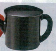
10-811-7 S-9-34 A (特大) ゆとう 朱 (540cc) ¥3,200 (10.8φ×11.5) 櫃80