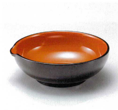
10-818-8 S-8-93 M 片口こね鉢 黒内朱 9寸 ¥4,000 (26.2φ×8.7) 梱20