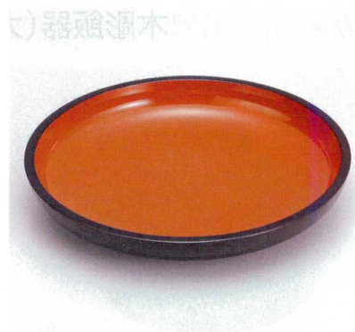
10-818-10 1-562-1 M 平こね鉢 黒内朱 浅型 尺2寸 ¥7,900 (36.7φ×5.9) 梱6