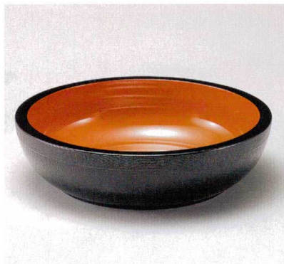
10-818-4 1-546-39 A 9寸漉布目こね鉢 黒木目内朱 ¥2,400 (26.3φ×8.3) 梱20