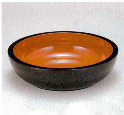
10-818-1 S-9-43 A 9寸こね鉢 黒内朱 ¥2,300 (26.3φ×8.3) 梱20