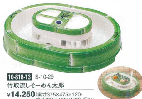
10-818-13 S-10-29 竹取流しそーめん太郎 ¥14,250 (実寸375×475×120・ 箱寸391×492×130) 梱12 単1乾電池2本使用(別売)。 家庭用流しそーめん器。