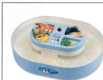
10-818-12 S-10-28 流しそーめん太郎 ペンギン ¥12,400 (実寸310×410×120・ 箱寸326×425×130) 梱12 単1乾電池2本使用(別売)。 家庭用流しそーめん器。