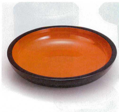
10-818-11 S-10-60 M 尺2寸新こね鉢 黒内朱 ¥7,950 (35φ×10) 梱6