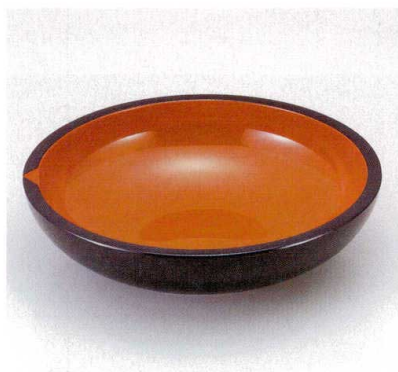
10-818-9 1-562-4 M 片口こね鉢 黒内朱 尺3寸 ¥9,500 (38.8φ×10.1) 梱10