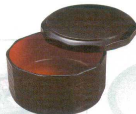
10-819-4 W-3-20 TA ミニ木彫飯器 溜内朱 ¥2,050 (13φ×8) 櫃100