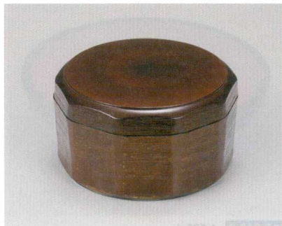
10-819-2 U-1-81 木内裏 縁なし白杮 TA 木彫飯器 (大) 枺 ¥3,500 (17.5φ×10・内寸16.3φ×6.2)