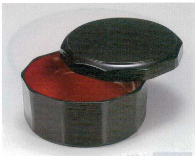
10-819-1 U-1-79 TA 木彫飯器 (大) 溜内朱 ¥3,700 (17.5φ×10・内寸16.3φ×6.2)