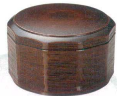
10-819-5 W-3-15 TA ミニ木彫飯器 枺 ¥2,150 (13φ×8) 櫃100