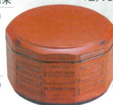
10-819-6 W-3-16 TA ミニ木彫飯器 根来 ¥2,350 (13φ×8) 櫃100