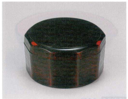
10-819-3 U-1-80 TA 木彫飯器 (大) 曙 ¥4,900 (17.5φ×10・内寸16.3φ×6.2)