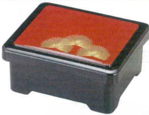
10-821-2 TA 耐熱井重 1-7-11 新木目漆調春慶内朱塗 ¥3,600 (16.8×14.3×7.8) 楕60