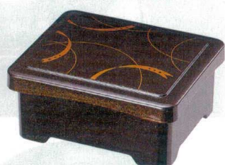
10-821-3 TA 耐熱象足井重 1-564-1 朱パール若松内朱塗 ¥2,350 (16.8×14.3×7.6) 楕60