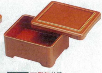
10-821-1 TA 象足千筋井重 漆調春慶内朱塗 U-1-82 ¥3,200 (16.8×14.3×7.8) 楕60