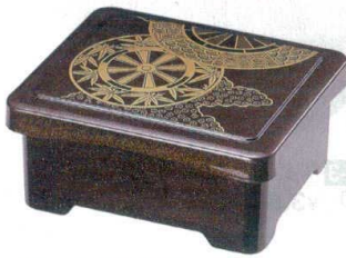
10-821-6 TA 耐熱象足井重 U-1-11 黒梨地のし柄内朱塗 ¥2,350 (16.8×14.3×7.6) 楕60