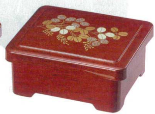
10-821-7 TA 耐熱象足井重 U-1-12 梨地御所車内朱塗 ¥2,400 (16.8×14.3×7.6) 楕60