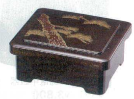
10-821-11 TA 耐熱錦井重 1-564-4 朱パール若竹内朱塗 ¥3,600 (18.1×15.2×8.3) 楕50