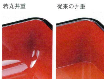
若丸丼重 従来の丼重