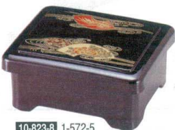
10-823-8 1-572-5 A 象足井重 パール扇面内朱塗 ¥1,700 (16.8×14.3×7.6) 櫃60