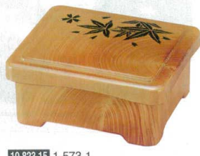
10-823-15 1-573-1 A 象足井重 花梨春秋内朱塗 ¥2,700 (16.8×14.3×7.6) 櫃60