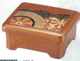
10-823-13 1-572-8 A 象足井重 梨地御所車内朱塗 ¥1,900 (16.8×14.3×7.6) 櫃60