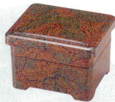
10-823-19 A 象足井重 木ノ葉内朱塗 1-573-6 1段 ¥2,650 (16.8×14.3×7.6) 櫃60 2段 ¥3,950 (16.8×14.3×11.3) 櫃30 1-573-6A 中段のみ ¥1,300 (15.4×13×4) 櫃80