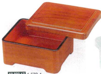
10-823-17 1-573-4 A 象足井重 紫檀内朱塗 エース塗 ¥3,000 (16.8×14.3×7.6) 櫃60