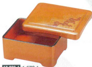
10-823-4 1-572-1 A 象足井重 野菊内朱 ¥1,650 (16.8×14.3×7.6) 櫃60