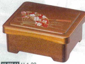
10-823-14 U-1-22 A 象足井重 梨地新扇面内朱塗 ¥2,000 (16.8×14.3×7.6) 櫃60