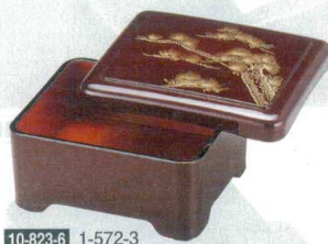
10-823-6 1-572-3 A 象足井重 溜老松内朱塗 (蓋のみ柄入) ¥1,650 (16.8×14.3×7.6) 櫃60