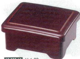
10-823-16 U-1-20 A 象足井重 溜内朱塗 S-S塗 ¥2,600 (16.8×14.3×7.6) 櫃60