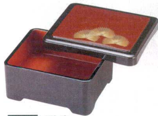
10-823-12 1-572-10 A 象足井重 朱パール若松内朱塗 ¥1,950 (16.8×14.3×7.6) 櫃60