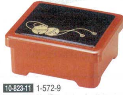
10-823-11 1-572-9 A 象足井重 朱パール鈴内朱 ¥1,900 (16.8×14.3×7.6) 櫃60