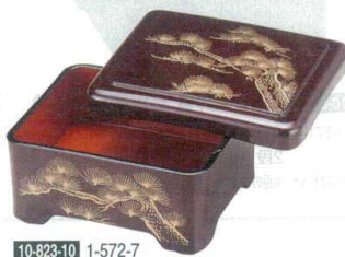
10-823-10 1-572-7 A 象足井重 溜老松内朱塗 (身・蓋柄入) ¥1,900 (16.8×14.3×7.6) 櫃60