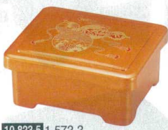
10-823-5 1-572-2 A 象足井重 金パールひさご内朱 ¥1,650 (16.8×14.3×7.6) 櫃60