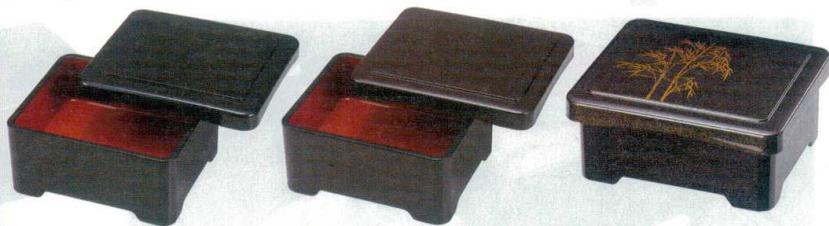
10-823-1 U-1-75 A 象足井重 黒内朱塗 ¥1,500 (16.8×14.3×7.6) 櫃60