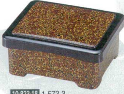
10-823-18 1-573-3 A 象足井重 金虫喰内朱塗 ¥2,850 (16.8×14.3×7.6) 櫃60