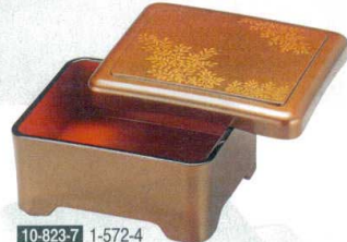
10-823-7 1-572-4 A 象足井重 梨地シダ内朱塗 ¥1,700 (16.8×14.3×7.6) 櫃60