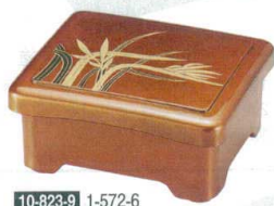
10-823-9 1-572-6 A 象足井重 梨地ラン内朱塗 ¥1,700 (16.8×14.3×7.6) 櫃60